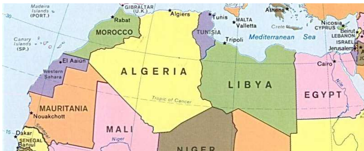
Kuva 2. Maghreb- alueen kartta. 68

Maghreb ( al-Magrib al-Arabi ) on arabiankielistä alkuperää oleva nimitys alueelle, joka rajoittuu idässä Niiliin, lännessä Atlantin valtameren, pohjoisessa Välimeren ja etelässä Saharaan. Sanalla Maghreb tarkoitetaan ”auringonnousun maita”. Alue käsittää Algerian