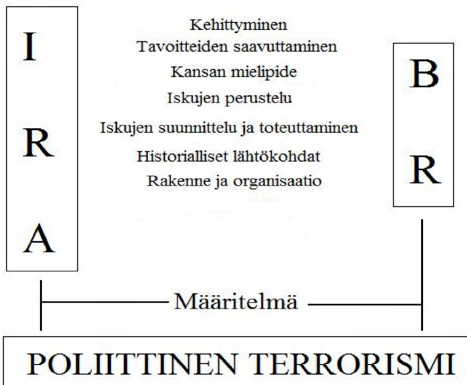
Kuva 1. Tutkimuksen viitekehys

Tutkimuksessa keskitytään käsittelemään pääasiallisesti IRA:n ja BR:n toimintaa kyseisenä ajanjaksona. Pohjois-Irlannin tapahtumia käsitellessä ei poliisin, Ison-Britannian armeijan ja unionistien toimintaa ja taktiikoita käsitellä kuin pintapuolisesti. Italian tapahtumia käsitellessä ei oteta huomioon rikollisjärjestöjen osuutta väkivaltaan, ja poliisin ja oikeistoterroristijärjestöjen osuutta tapahtumiin käsitellään myös vain pintapuolisesti.