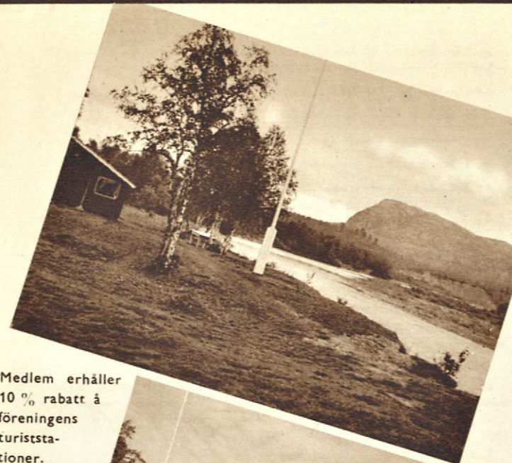
Medlem erhåller 10 % rabatt å föreningens turiststationer.