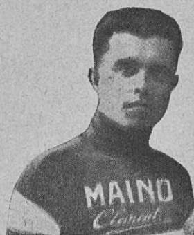
Learco Guerra, Italien, cykelvärldsmästare.