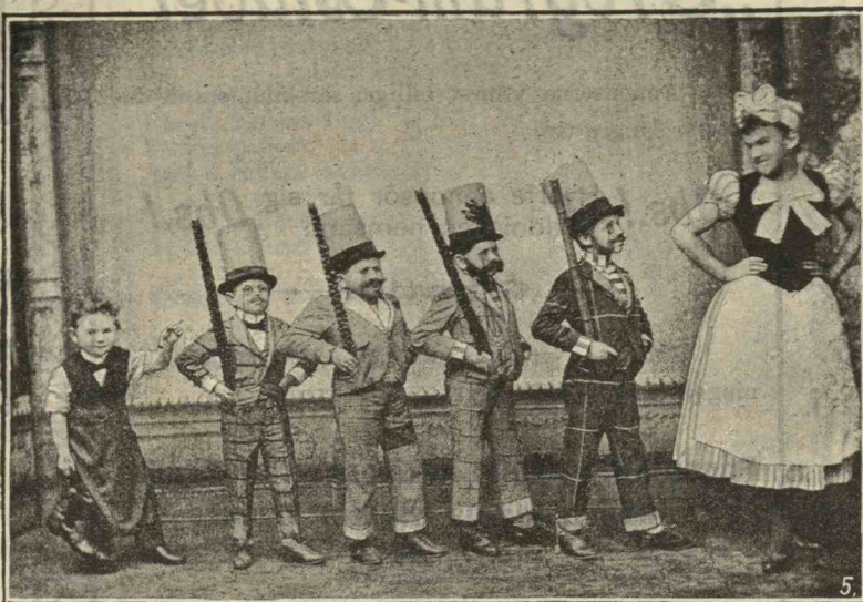
Colibri Liliputaner truppen.

Helsingfors Elektriska Belysnings Aktiebolag.