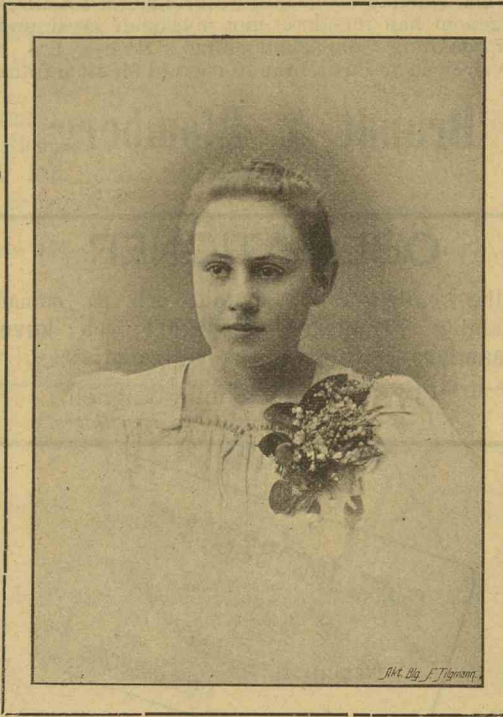
Fröken Aino Achté.