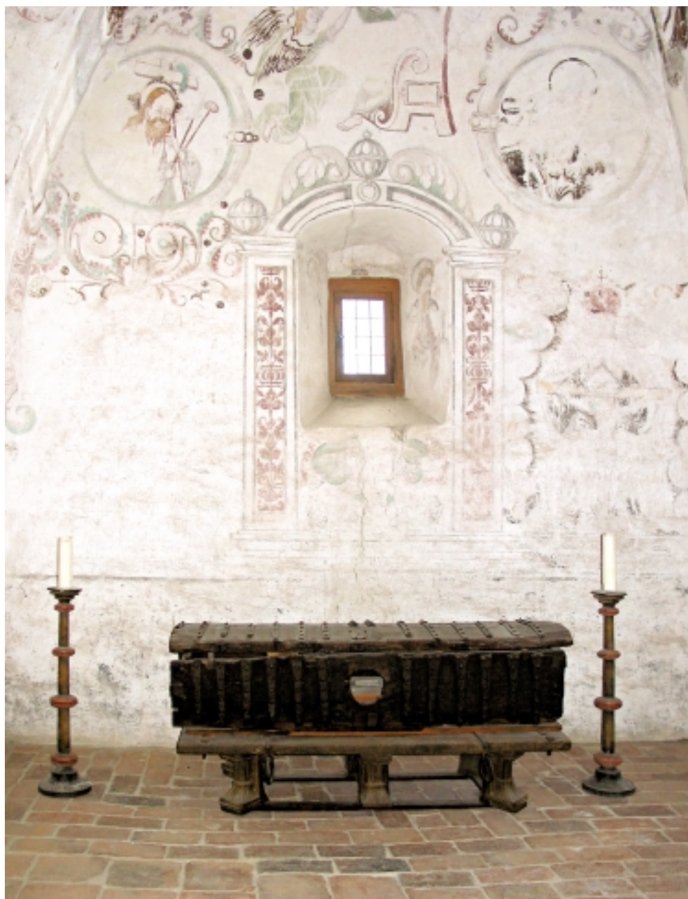
Sanctum Sanctorum, "Birgittas bönekammare" i Vadstena kloster. I kistan transporterades Birgittas kvarlevor från Rom till Vadstena. Kalkmålningarna tillkom 1581-1582.