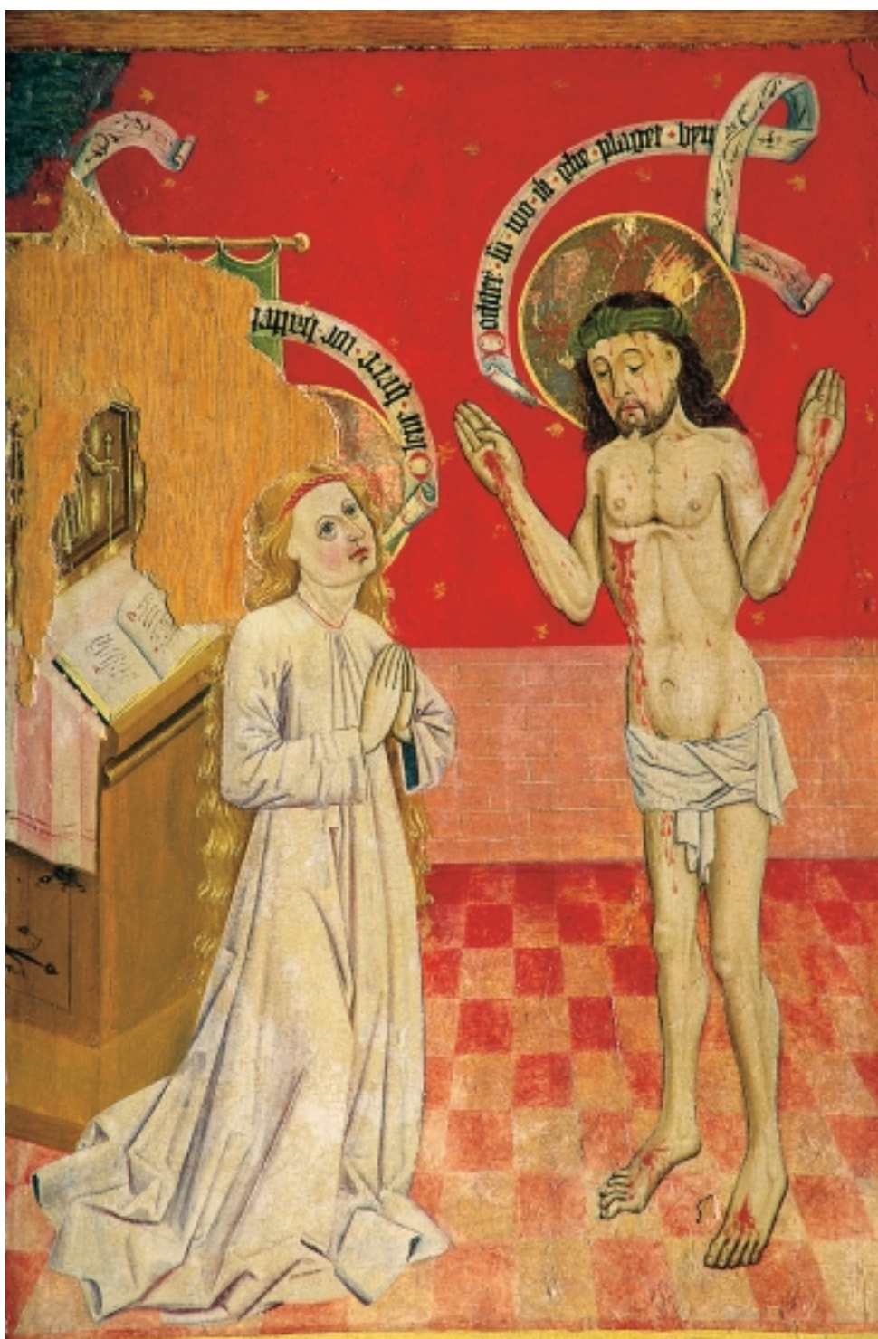
Kristus visar sig för Birgitta när hon är i tioårsåldern. Detalj av altarskåp daterat till ca 1450-1475, från Appuna kyrka i Östergötland (nu i Statens Historiska Museum, Stockholm).