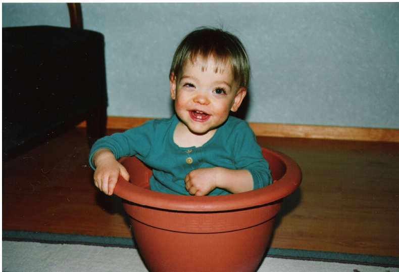
KUVIO 2. Oikean silmän sisään- ja ylöskarsastus. (Tuominen Tarja 1996.)

Amblyopiaa esiintyy harvoin lapsilla, joilla on ylä-alasuunnan tropiaa. Tällaisessa tilassa yleensä onnistuu ylläpitämään kahden kuvan yhteensulautumisen poikkeavalla pään asennolla. (Von Noorden 1996: 218.)