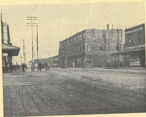
Missionslokalen, Mission street n:o 9.

Herrens nåd, hjälp och välsignelse fick man erfara äfven under de följande åren. Såsom redan blifvit