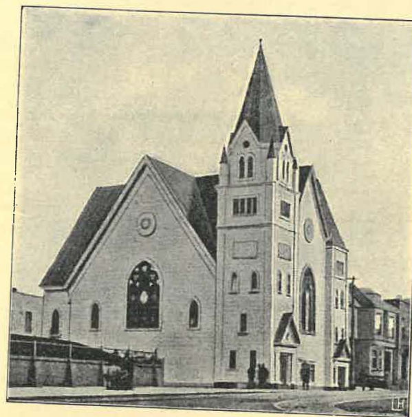
Den nya kyrkan.

hamson. Direktionen för sjömansmissionen lofvade att mot inteckning gifva ett byggnadslån. Församlingens medlemmar ville att man genast skulle taga itu med byggnadsarbetet, men dess förman motsatte sig såsom erfaren byggmästare detta. Han visste, att i dyliga saker är det lättare att fatta beslut än att förverkliga