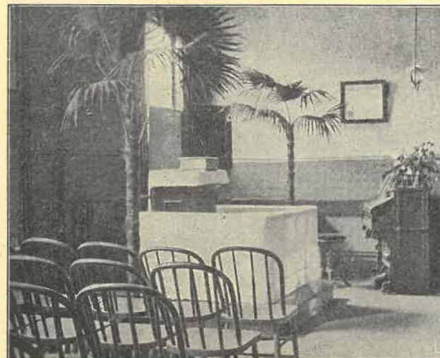
Missionslokalen i San Francisco, Missionstreet n:o 9.