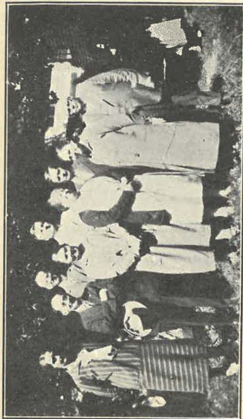
Minnesotalaisia Veljeysseuran vuosikokouksessa Dodgevillessä, Mich.

Kuten jo aikaisemmin mainittiin, vietettiin seuran vuosikokous Dodgevillessä, Mich., kesäk. 14—16 p. Osanotto kokoukseen oli runsaampi kuin moniin vuosiin. Varsinaisia Veljeysseuraan kuuluvia raittiustietäjien edustajia ei tosin ollut enempää kuin ennenkään, mutta saapuvilla oli edustajia itsenäisistä raittiustietäjistä, kalevai-