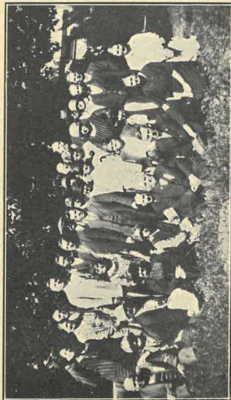
Edustajat Veljeysseuran vuosikokouksessa Dodgevillessa, Mich.

Vuosikokouksen aikana Dodgevillessa, Mich., esimiehen vuosikertomuksesta ilmeni että paikallisseurojen lukumäärä on ollut 35 ja näitten yhteinen jäsenluku 817. Kaikesta tästä huolimatta on toimittu siinä varmassa uskossa että pilvisen-