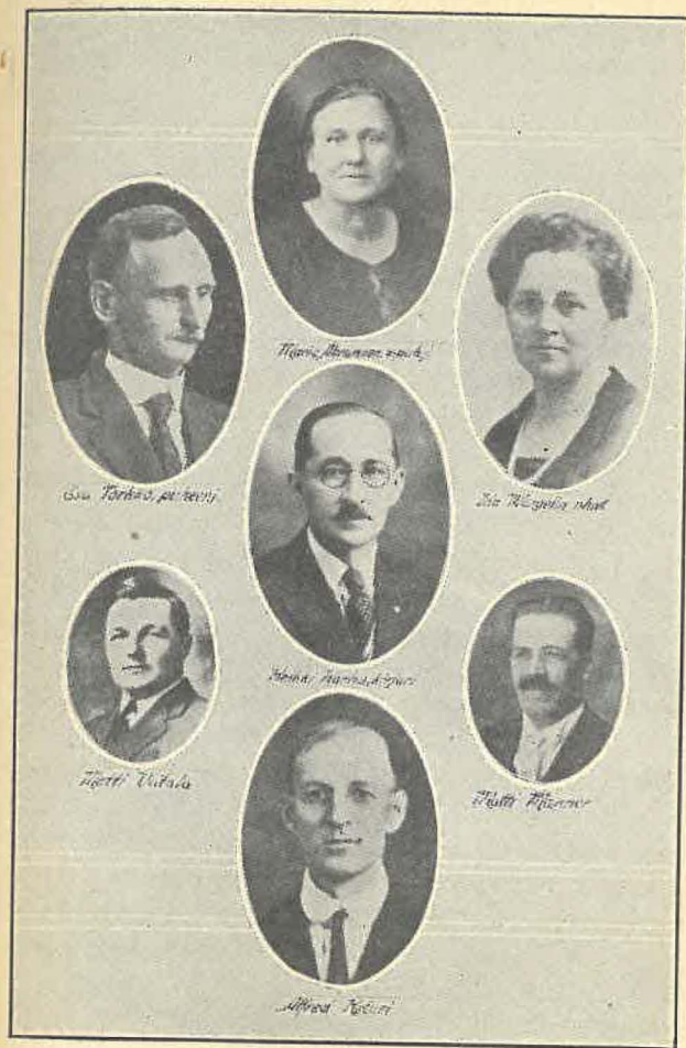
Veljeysseuran nykyinen johtokunta.

Vuosikokouksemme johtokunnan toteutettavaksi jättäneistä tärkeimmistä päätöksistä voimme tässä mainita, että seurojemme toimesta suurille suomalaisasutuksille järjestettäisiin englanninkielisiä nuorison kieltolakikokouksia, joissa koetettaisiin Amerikassa syntyneet nuoret suomalaiset saada esiintymään kieltolain puoltajina sekä perustettaisiin englaninkielellä toimivia nuorison kieltolakisuojeleusliittoja niille paikkakunnille, joissa ei ole toimassa nuorten kristillisiä yhdistyksiä. Niillä paikkakunnilla taas, joissa seurakuntiemme toimesta on toiminassa nuorten kristilliset yhdistykset, kohdistettaisiin työ niitten keskuuteen ja painostettaisiin kasvatuksellisen raittiustyön tekemistä sunnuntaikouluihin. Toisena tärkeänä tehtävänä jäi johtokunnalle Raittiussuhteiden kanssa yhteisen vakituisen puhujan hankkiminen. Vuosikokouksessamme pidettiin puhujaa välttämättömänä. Entisten kokemusten perusteella katsottiin kymmenen kuukauden aika vuodesta riittäväksi työkaudeksi. Pidettiin myöskin