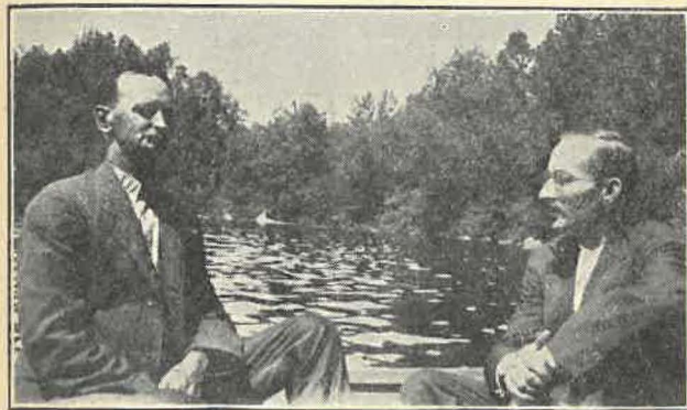
Esimies ja kirjuri miettimässä mitä tehdään saarella majaillevalle viinankauppiaille.

Mies meloi... Ei tullut maalle sitä tietä. Palasimme kämpälle. Siellä valmistauduttiin kala-