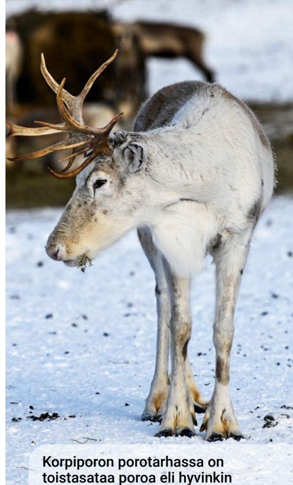
Korpiporon porotarhassa on toistasataa poroa eli hyvinkin kahden puolen puuta.

naan lyhyeksi aikaa myös muihin matkailupitäjiin. Pöllänen on vierailut poroineen muun muassa Sotkamossa.