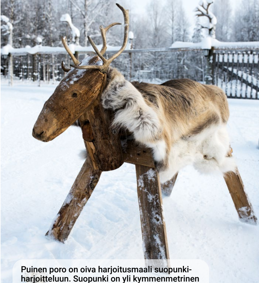
Puinen poro on oiva harjoitusmaali suopunki-harjoitteluun. Suopunki on yli kymmenmetrinen poron kiinniottoon kehitetty heitonaru.