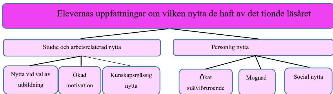
Figur 3. Elevernas uppfattade nytta efter det tionde läsåret.

Vid analysen av de svar som kopplades till den tredje forskningsfrågan, kunde två olika kategorier av uppfattningar identifieras (figur 3). Dessa kategorier var Studie och arbetsrelaterad nytta och personlig nytta . Kategorin studie och arbetsrelaterad nytta delades in i, nytta vid val av utbildning , ökad motivation , kunskapsmässig nytta . Kategorin personlig nytta delades in i underkategorierna ökad självförtroende , mognad och socialnytta . Eleverna upplevde alltså att de hade haft nytta av utbildningen som de fick under det tionde läsåret på många olika plan.