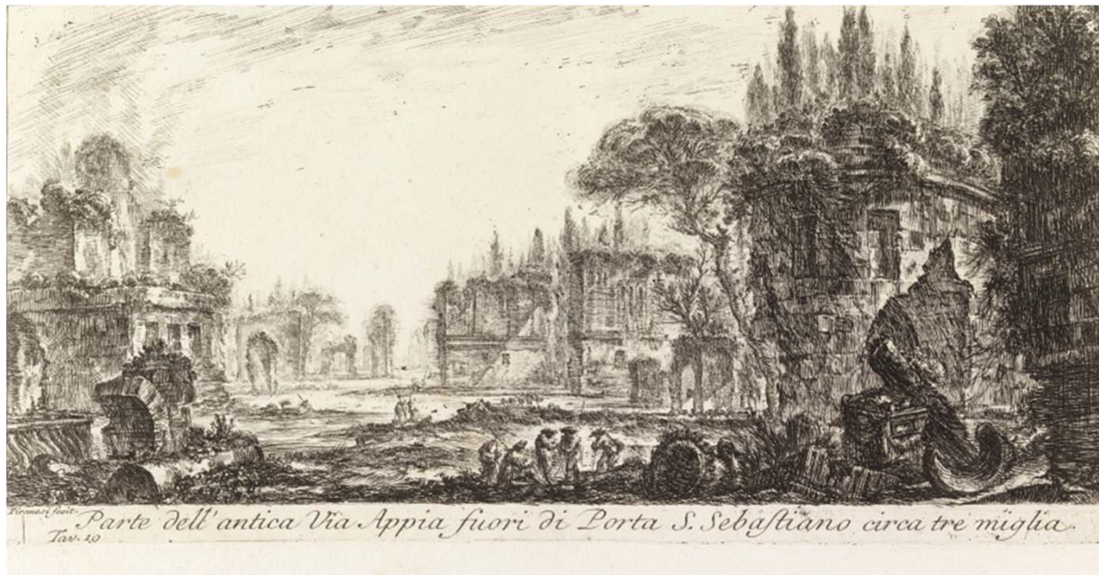
Giovanni Battista Piranesi, Vanhaa Via Appiaa Roomassa, ajoittamaton, Antellin kokoelmat, Kansallisgalleria / Sinebryhoffin taidemuseo.

KANSALLISGALLERIA • FINLANDS NATIONALGALLERI • FINNISH NATIONAL GALLERY •