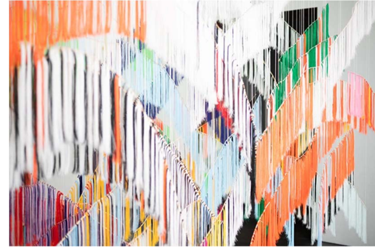
Outi Pieski, Our Land, Our Running Colours , 2015, Kansallisgalleria / Nykytaiteen museo Kiasma.

KANSALLISGALLERIA • FINLANDS NATIONALGALLERI • FINNISH NATIONAL GALLERY •