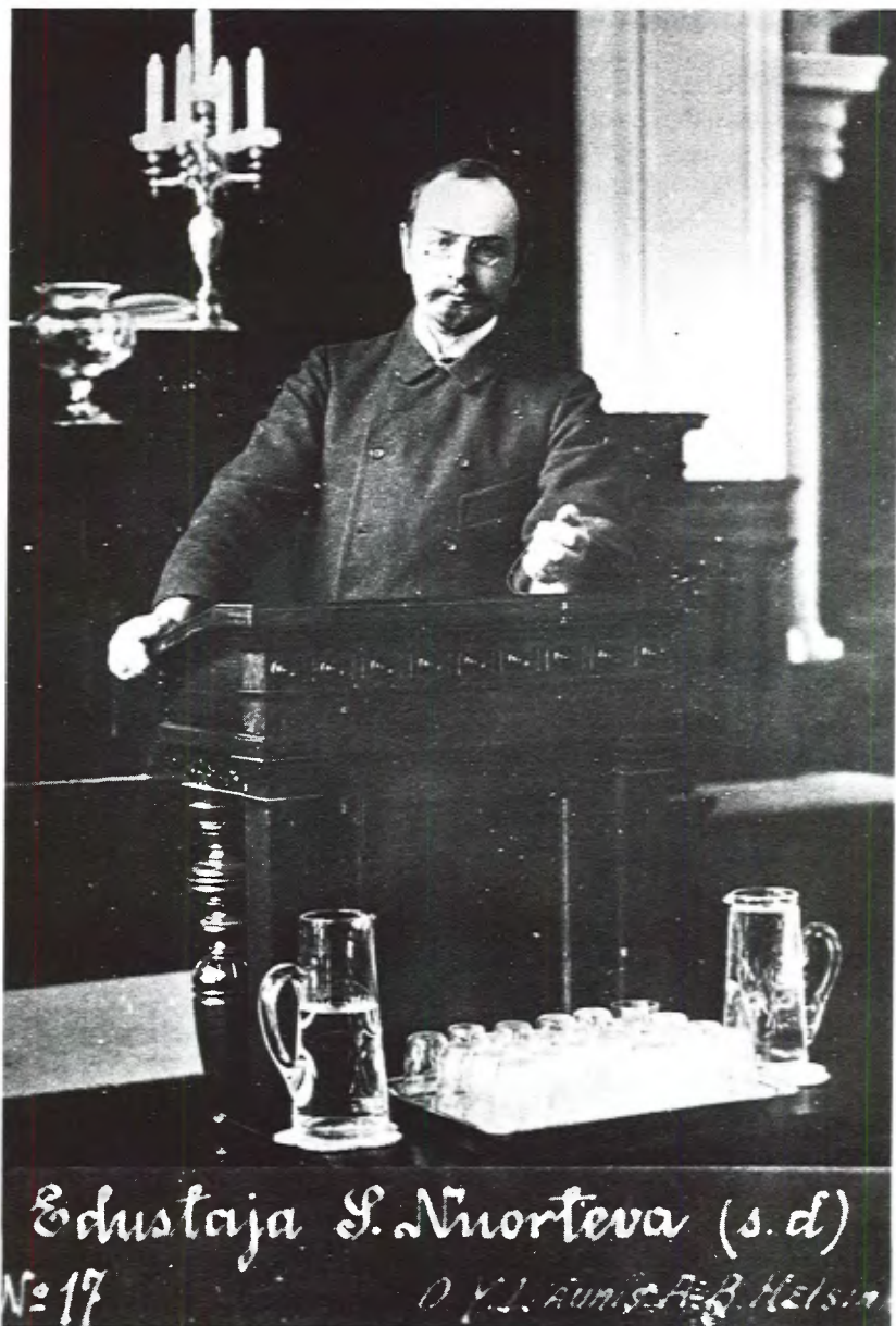
Kuva 1. Kansanedustaja Santeri Nuorteva yksikamarisen eduskunnan ensimmäisellä istuntokaudella v. 1907. (TA)