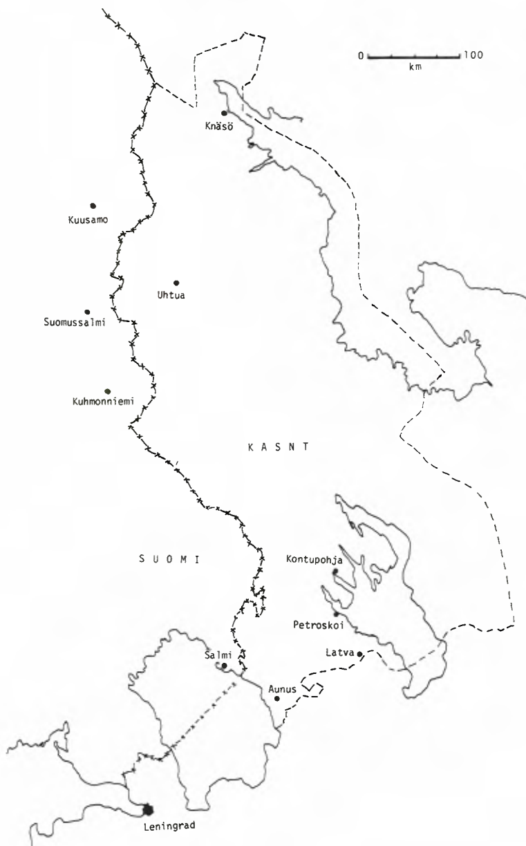
Kartta 2. Karjalan Autonomisen Sosialistisen Neuvostotasavallan alue