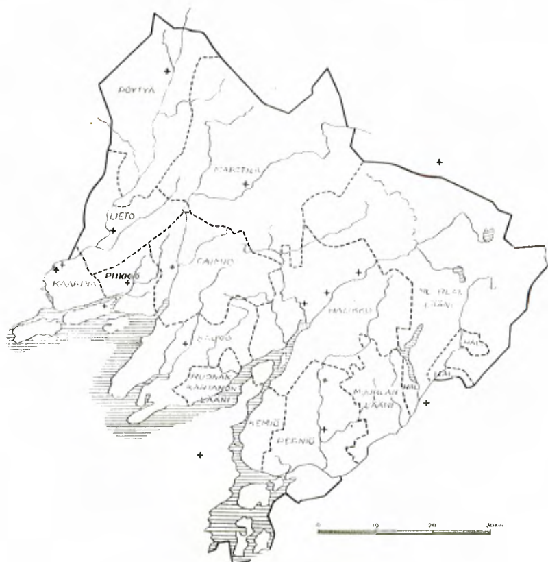
Etelä-Suomen mantereen nimismiespitäjien alueet keskiajan päättyessä.

hemmista asiakirjoista, ovat Säkkiäsalon verokunnan siirto Kemiön nimismiespitäjältä Perniön nimismiespitäjään vuonna 1464 ja Teijon verokunnan siirto Perniön nimismiespitäjältä Kemiön nimismiespitäjään vuonna 1540. 9 Teijon verokunta liitettiin viimeksi mainittuna vuonna Kemiön nimismiespitäjän Svidjan verokuntaan, josta näin tuli Svidja—Teijon verokunta.