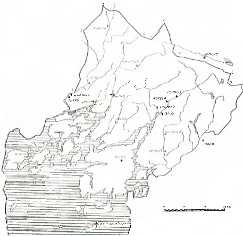
Keskiaikaisen Etelä-Suomen alue ja rajat. Rajapaikat: 1. Kuralankoski, 2. Kuhankuono, 3. Ordenojan Perälähte, 4. Partavaha, 5. Hevonlinnanotsa, 6. Pirttiniemennenä, 7. Laurinsaari, 8. Vainovaha, 9. Herakanlähde ja 10. Pitkäpaasi.

Maarian pitäjän alue, on lukuisia asiakirjatietoja jo keskiajalta, vuodesta 1410 lähtien. Niiden mukaan rajan kiintopisteinä olivat Muusammas, Vainohattu eli Harmaavaha, Laakkarinvuori, Jortinkallio ja Kuivalatva Liedon Pahkaloukkaan jakokunnan kohdalla, Halkivaha Liedon Pahkaloukkaan ja Tammentaan jakokuntien yhtymäkohdassa, Lällinlähde ja Halikonsuonnummi Liedon Tammentaan jakokunnan kohdalla, Vahtermäki Liedon Tammentaan jakokunnan ja Karviaisten kylän yhtymäkohdassa, Maansillanpää Liedon Karviaisten kylän koh-