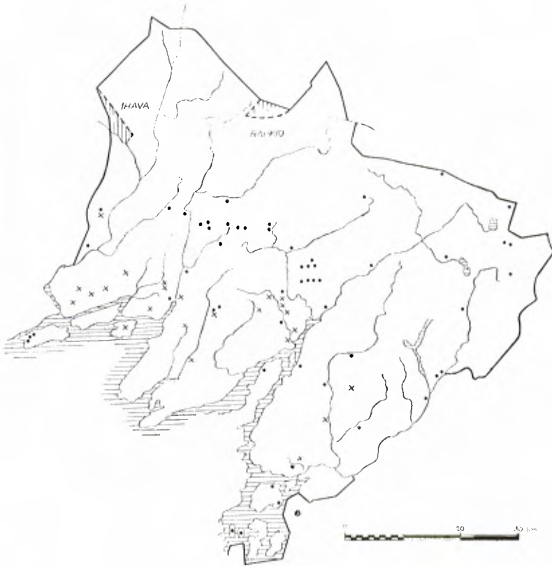
Etelä-Suomen mantereen ulkoveromaat, niittyjakokunnat ja pitäjien yhteismaat. Pisteet tarkoittavat ulkoveromaita, ristit niittyjakokuntia ja viivoitetut alueet pitäjien yhteismaita.

nassa oli niittyjä Perniön Aaljoen, Aimontapon, Arpalahden, Ervelän, Haaroisten, Huhdin, Ketunpyölin, Kieronperän, Knaapilan, Kuhmisten, Kumionpään, Kuustonpyölin, Lassinpyölin, Metsänojan, Mäki-saurun, Paarskylän, Pohjankylän, Päärin, Sormijärven, Suomenkylän, Sydänsaurun ja Yliskylän kylien taloilla.