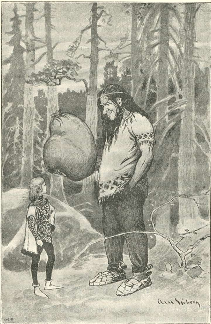
Jättiläisen mielestä ei säkki ollut raskas.