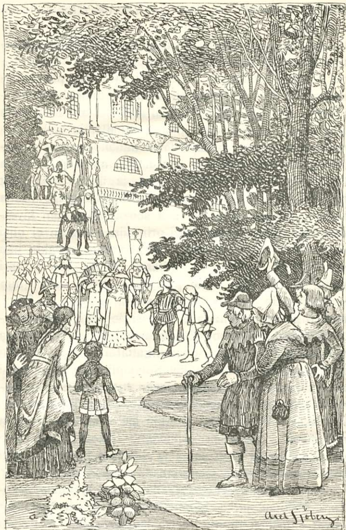
Alvi-prinssi vei Sölvín kuninkaan ja kuningattaren luo.