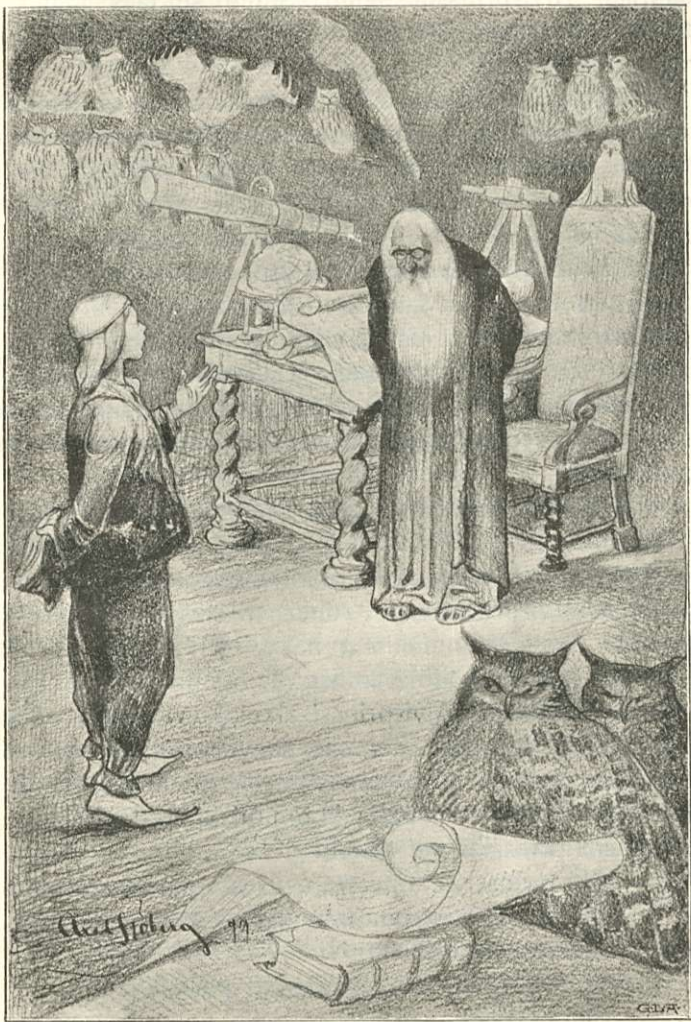
Alvi-prinssi Tietäjän tornissa.