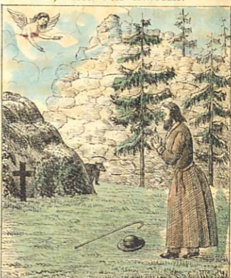
Autio's sista bön.