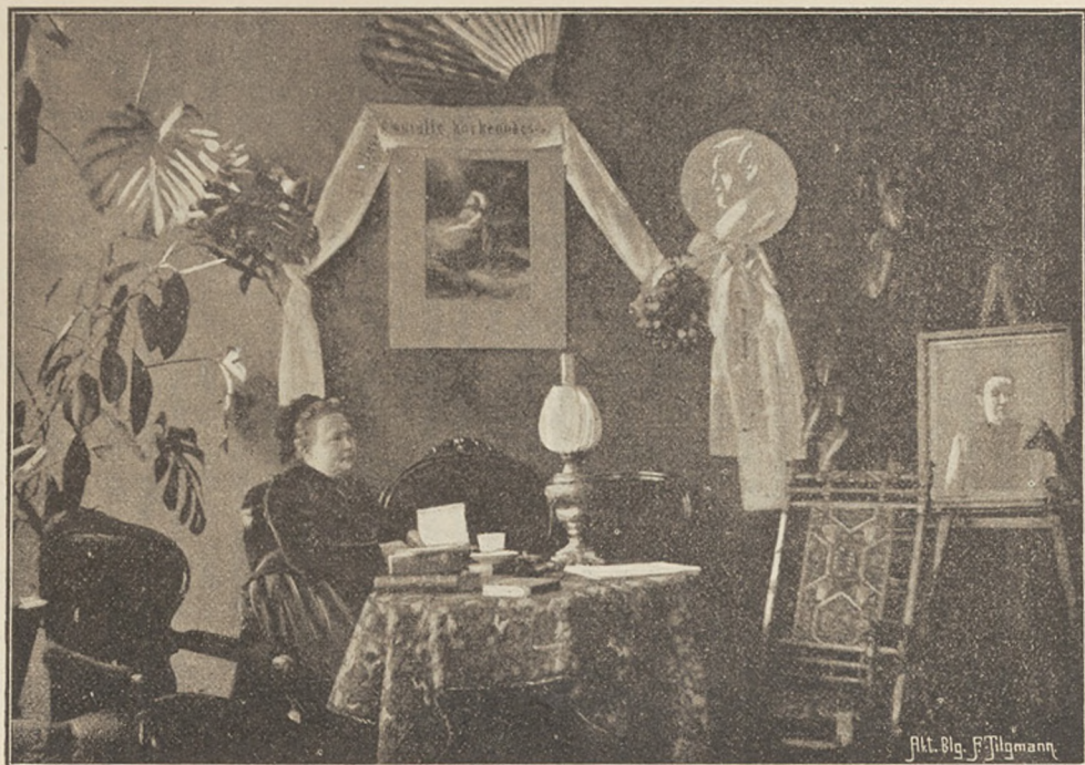
Minna Canth kotonaan.