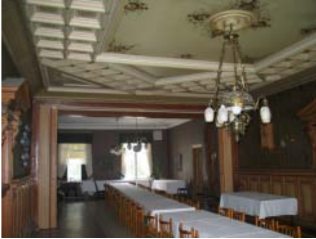
Alakerran iso kokoontumis- /ravintolatila