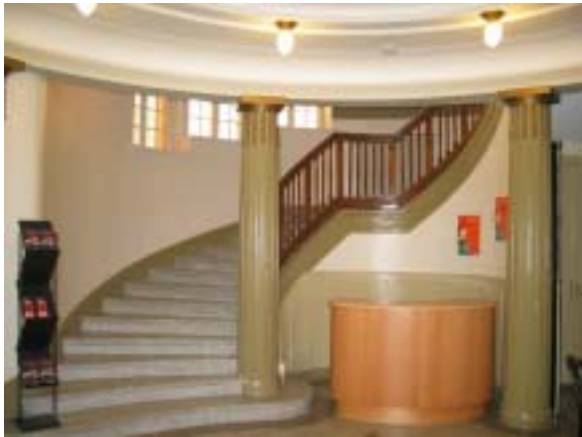
Yläkertaan vievät rappuset