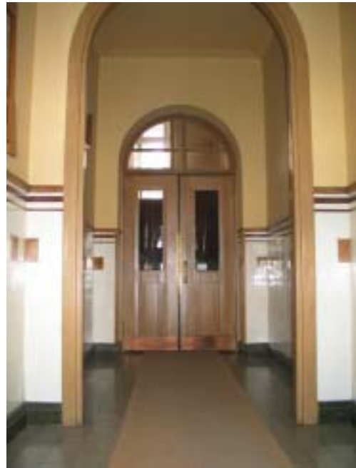
Wasaborgintalo, Vaasanpuistikko 14 A