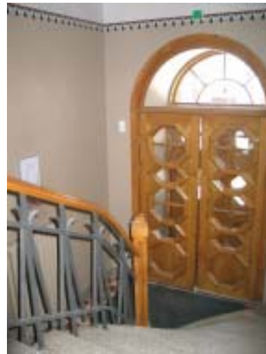
Unitas-liikerakennus, Alatori 3A, Carl Schoulz & W. G. Palmqvist 1926