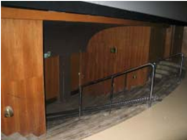
Salin etuosassa on portaat/syvennys, koska siellä on ennen ollut teatterilavastus.