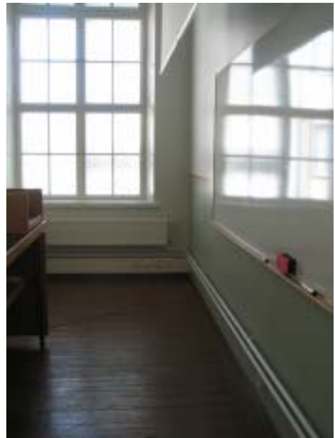
Luokkahuoneessa säilytetty vanha puinen lattia

Rakennus on peruskorjattu ja nykyään Vaasan ammattikorkeakoulun käytössä. Nykyaikaisten turvasäädäntöjen takia on jouduttu yksityiskohtia muuttamaan, kuten porraskäytävän kaiteeseen on lisätty lasi, koska kaiteen pylväät olivat liian kaukana toisistaan. Myös kaidetta on jouduttu korottamaan. Käytävät on maalattu vanhoilla sävyillä, mutta hohtavat uutuuttaan. Ainoana vanhana tilana on säilynyt juhlasali. Sen koristeelliset lamput ovat alkuperäiset. Niiden varjostimet on kuitenkin pitänyt tilata aina Saksasta saakka, jossa ne on tehty yhden alkuperäisistä säilyneen varjostimen mukaisesti. Kahdessa luokassa on säilytetty vanha, puinen lattia sekä kattolistat. Vanhat luokkahuoneiden nurkissa olleet kakluunit ovat saaneet väistyä nykyaikaisten ilmankiertokanavien edestä.