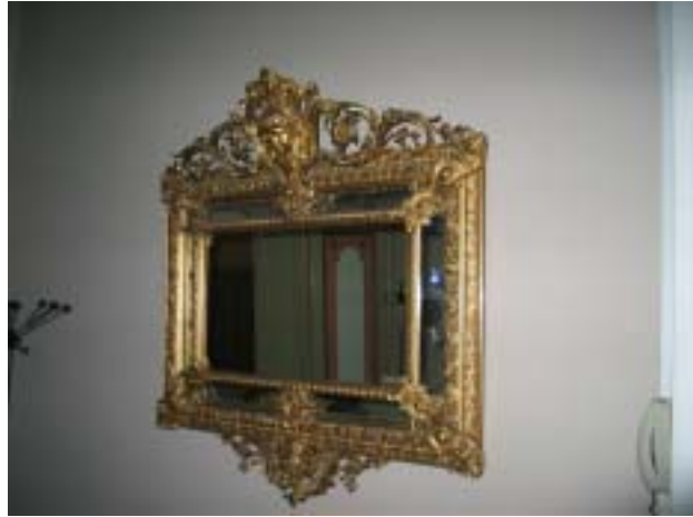
Peilialin kukkakoristeellinen lamppu ja peili