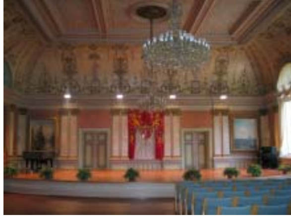
Juhlasali - parveltakin voi katsella saliin