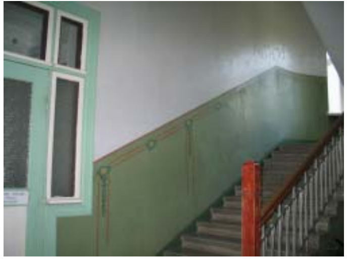
Lennart Backmannin talo, Rantakatu 3, A. W. Stenfors 1912