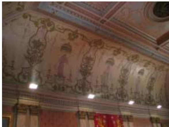
Kristallikruunut, salin kattoa kiertävät naishahmot