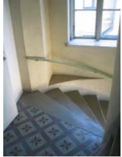
KOP:n /"Ravintola Kodin" sisäpihan rappukäytävä