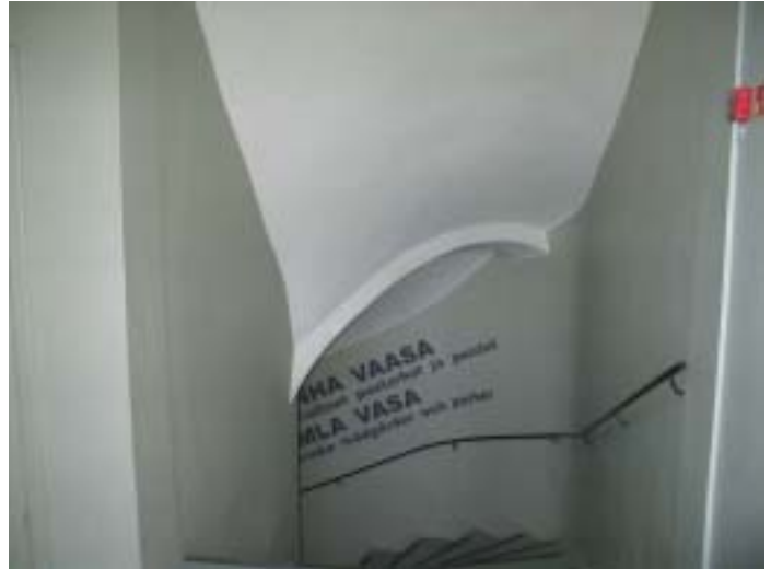
Kulunutta ja elänyttä lattiaa sekä kaartuva portaikko