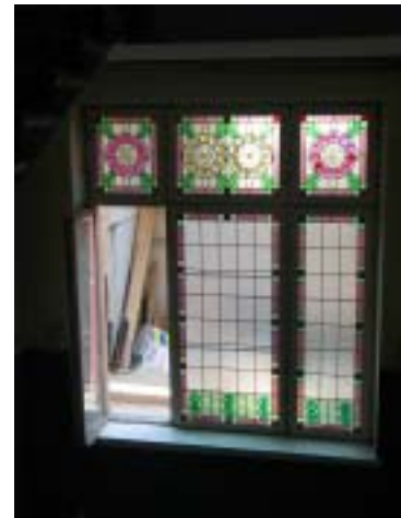
Commerce, Alatori 1B, Arkkitehtitoimisto Bruun & Schoulz, 1912