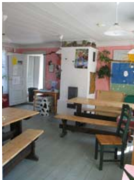
Tupa toimii kahvilana ja kerhuhuoneena