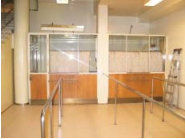
Vanhat lippuluukut on säilytetty