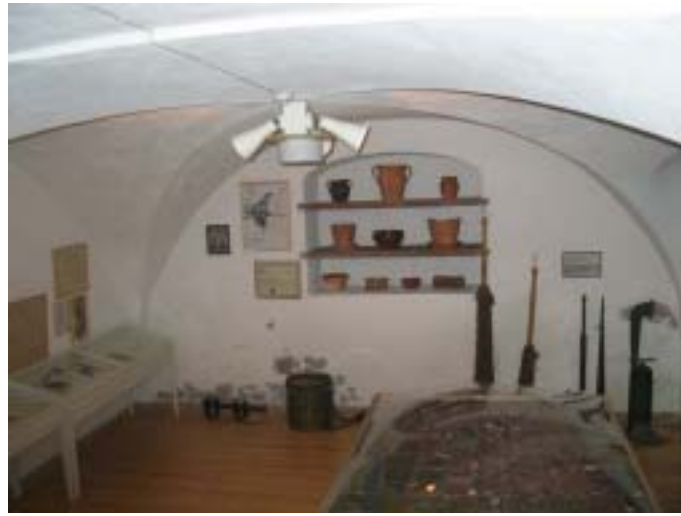
Kellarikerroksen pyöreäkattoiset huoneet