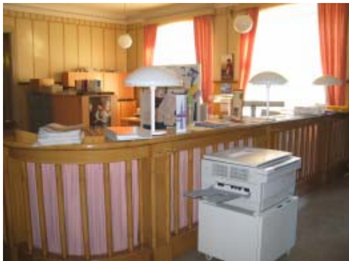
Vanha maistraatin tiski