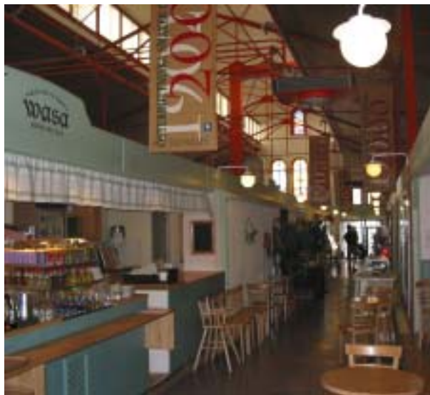
"Alaosan" punainen väritys