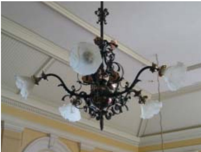
Koristeellinen juhlasalin lamppu