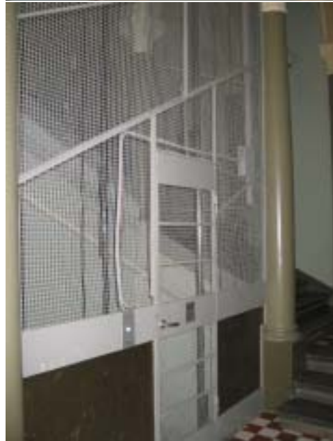
Vanha KOP:in talo / Kurtenia, Hovioikeudenpuistikko 11