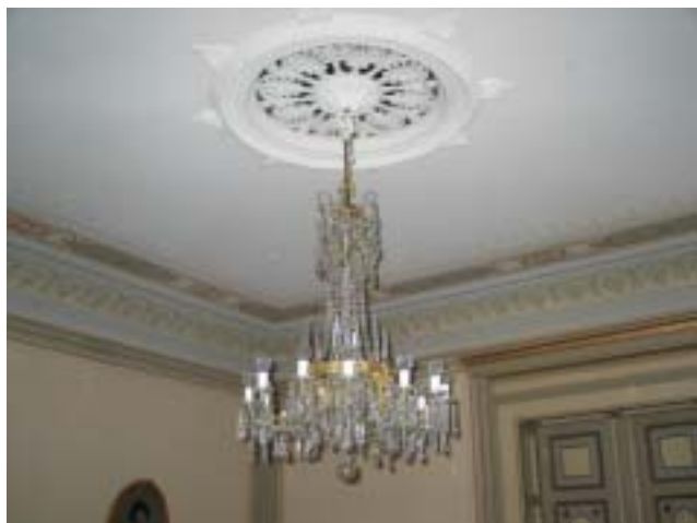
Käytävältä Kristallikruunu peilihuoneesta