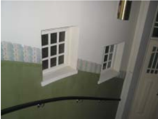
Wasaborgin talo/ Raastuvankadun ja Vaasanpuistikon kulma, Raastuvankatu 21 B