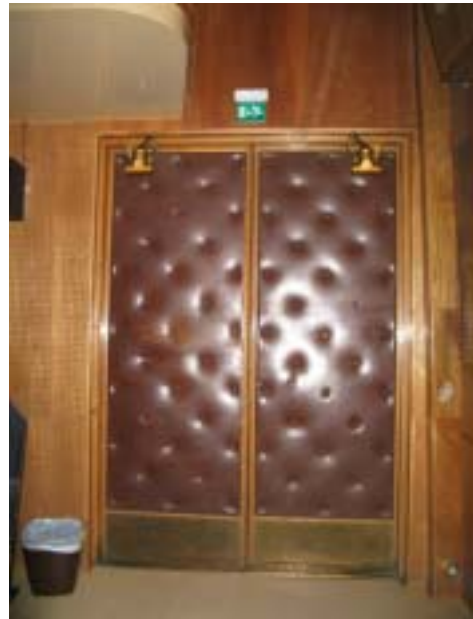
Arvokas ovi- odotustilan ja teatterisalin välillä.