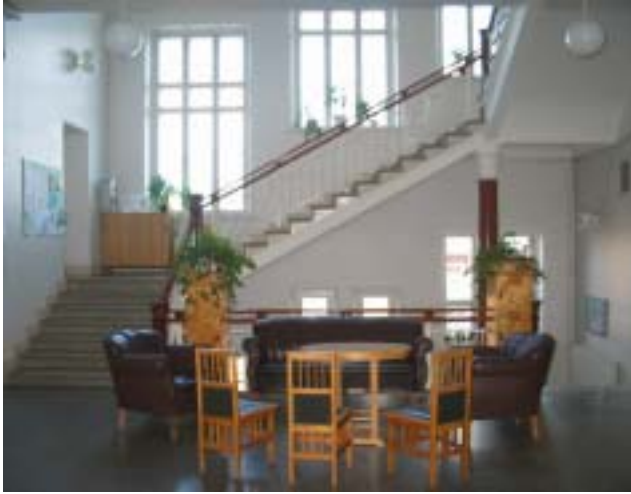
Yhteislukion vanhan osan käytävillä on jäljellä vanhoja huonekaluja.