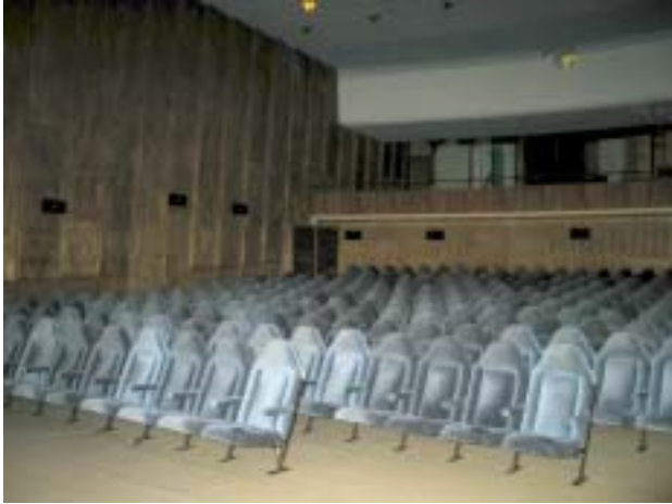
Puupaneelein pinnoitetut teatterisalin seinät

Wasa Palats toimii nykyään elokuvateatterina. Tilat on tehty 1953. Aikaisemmin tiloissa ovat olleet Vaasan kaupungin teatteri sekä Wasa teater.