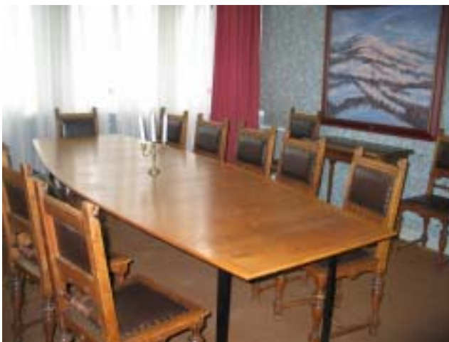
Pienempi kokoontumistila ja sinne johtavat ovet