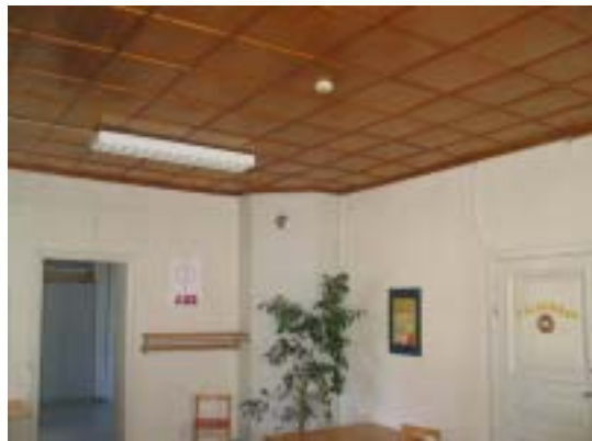
Erikoinen kattopinnoite, puulevyä