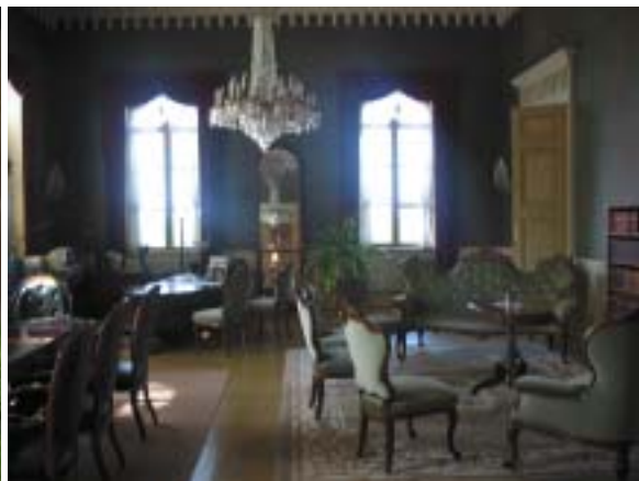
Hovioikeuden presidentin huone