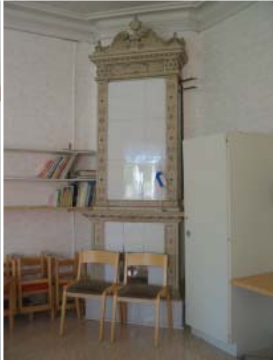
Joka huoneessa oli oma kakuuni