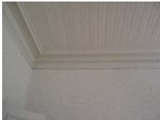
Vanhaa puista kattoa