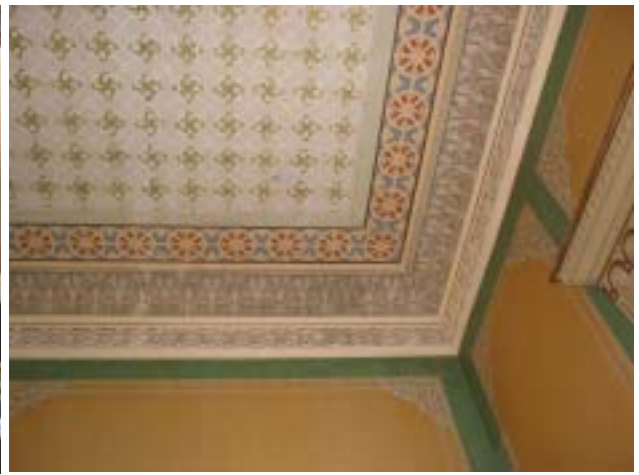
Koristeltua kattoa ja seinää