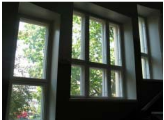
Myntin talo, Koulukatu 18 B