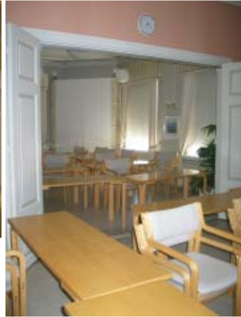
1. krs aula- ja kokoustilat