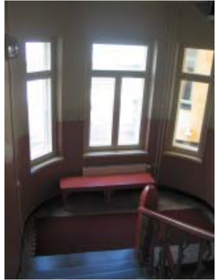
Hovioikeudenpuistikko 5 A