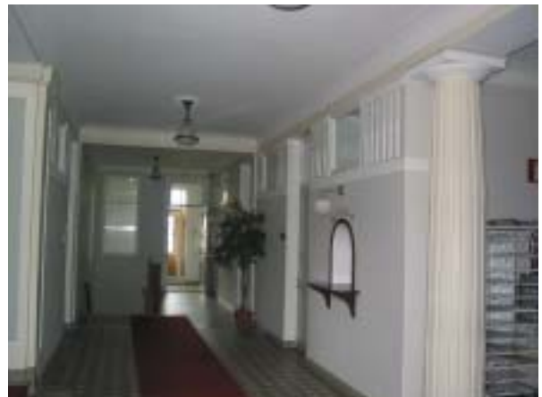
Puuvillatehtaan Konttori -rakennus, Palosaari, Yliopiston alue, nykyään tiloissa toimii Levón-instituutti