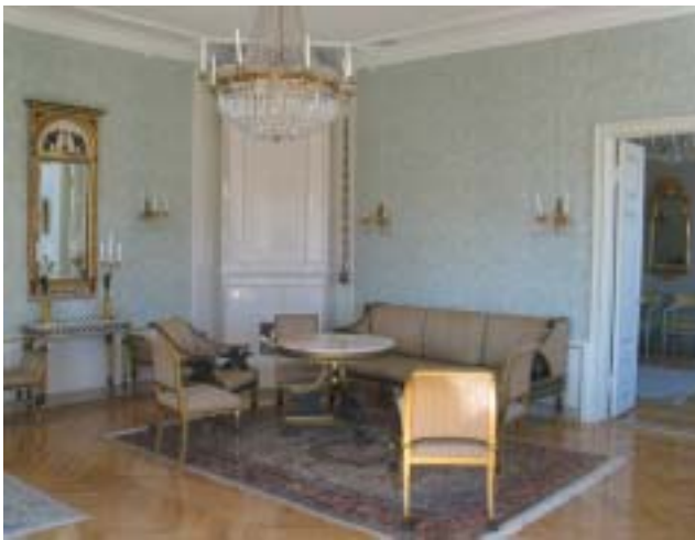
Empiretyylinen pääsali Iso ruokasali talonpoikaisrokokoossa