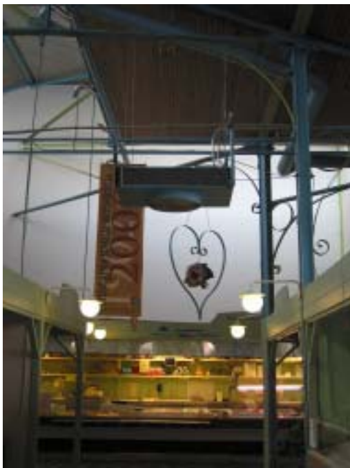
"Yläosan" sinertävä väritys

Halli Oy:ltä on pyydetty lausuntoa rakennuksen suojelusta, johon yhtiö suhtautuikin myönteisesti, mutta virallista suojelupäätöstä ei ole vielä annettu. Toivottavaa on, että halli voidaan nykyaikaisten suurten myymälöiden ja kilpailun lisääntymisestä huolimatta säilyttää elävänä ja toimivana historiallisena kauppapaikkana, eikä vain museo-rakennuksena.