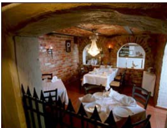
Ravintolan Bacchusin sisätiloja

Ruotsalainen klubi sisältää juhlahuoneiston 150 vieraille 1. kerroksessa, sekä klubitalat toisessa kerroksessa. Alapuolella kellarikerroksessa toimii ravintola Bacchus.