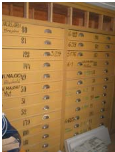
Matala huone, jossa vanha lautalattia. Ainutlaatuisia lipastoja