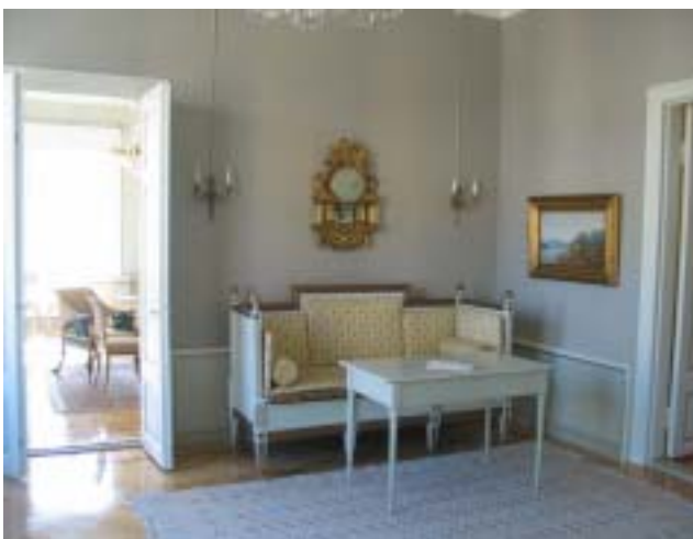
Pieni punssihuone kustavilaistyyliin