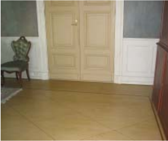
Lattia- ja seinäpinnoitteita