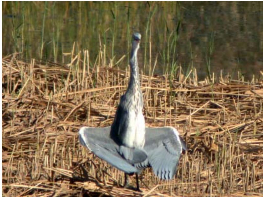
Harmaahaikara on syksyisellä lahdella päivittäinen näky.

Harmaahaikaran voimakas runsastuminen viime vuosina näkyy vain laimeasti Mietoistenlahden havaintomäärissä. Havaintojen lisääntyminen lahdella alkoi jo 1990- luvun alussa. Erityisen suuria paikallisten lintujen kertymiä ei lahdella ha- vaita ja esim. Helsingin Vanhakaupunginlahden syysmääristä (Mikkola-Roos, 2002) jäädään selvästi. Suurin paikallisena havaittu harmaahaikaramäärä on 11 yksilöä 28.7.1991 (Vanhakaupunginlahdella 34 lintua 26.9.2000) ja muuttavina 18 lintua 6.8.2000. Laskennoissa lintuja havaittiin säännöllisesti läpi kesän aina syyskuun alkupäiviin saakka. Syyskuun lopulla havainnot vähenivät selvästi ja viimeinen yksilö havaittiin 25.10. Kuukausittaiset maksimimäärät: 19. heinäkuuta 8, 10. elo- kuuta 7 ja 2. syyskuuta 5 lintua. Lajin runsastuminen näkyy Mietoistenlahdella erityisesti loppusyksyn havaintojen yleistymisenä. Ennen 1990-lukua harmaahi- kara oli jo syyskuun jälkipuolella harvinainen, mutta nyt lintuja nähdään sään- nöllisesti vielä lokakuussa. Lahden myöhäisin havainto on tehty 15.11.1999.