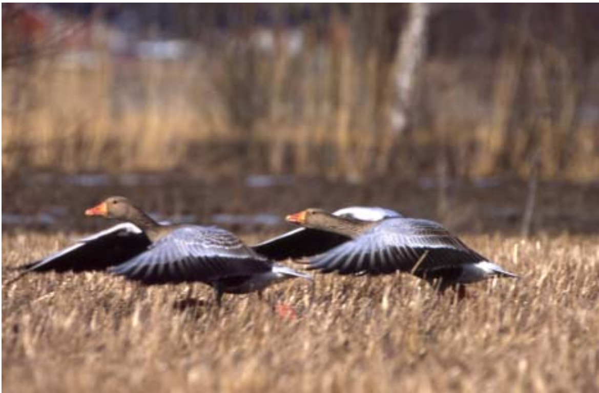
Merihanhen lentoonlähtö.