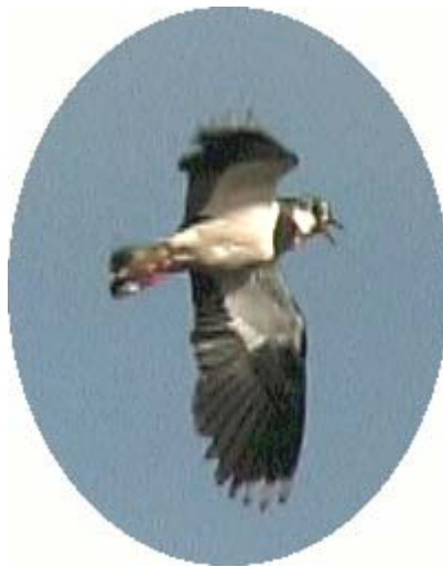
Huolestunut hyppäemo Käävässä.

Viimeaikaiset hoitotoimenpiteet: Koko alue on niitetty vesirajaan saakka ensimmäisen kerran syksyllä/talvella 1999/2000. Sen jälkeen vaihtelevalla alalla nykyisen laitumen eteläpuolelta. Kääppän laidunalaa on lisätty 9 ha ja laitumen hoitoa on tehostettu lisäämällä eläinten määrää ja tekemällä täydennysniittoja. Kokonaislaidunala on nykyisin 29 ha.