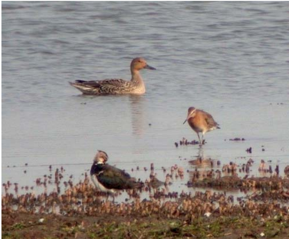
Mietoistenlahden monipuolista syyslennustoa: jouhisorsa, töyhtöhyyppä ja mustapyrstökuiiri 5.9.2002.

Mietoistenlahti on hoitotoimenpiteiden myötä palautunut ja kehittynyt Varsinais-Suomen mantereeseen ehkä merkittävimmäksi syysmuutonaikaiseksi lintualueeksi. Selvityksessä käytetty laaja aineisto osoittaa selvästi, että 1990-luvulla alkanut positiivinen kehitys kasvattaa yhä edelleen laji- ja yksilömääriä lahdella.