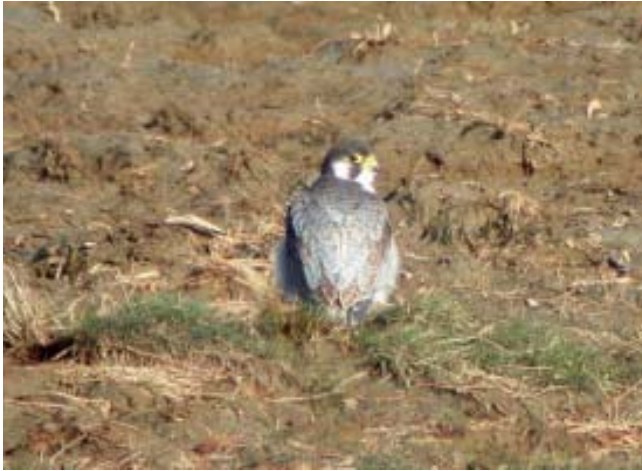
Esiakuinen muuttohaukka Sillankarin lietteellä 18.9.2002.

Muuttohaukan yleistyminen 1990-luvulta lähtien näkyy myös Mietoistenlahden havaintoaineistossa. Kun sekä 1970-, että 1980-luvuilla havaittiin lahdella kumpakin ajanjaksona yhteensä vain viisi yksilöä, tavattiin 1990-luvulla jo yli 20 yksilöä. 2000-luvulla varsinkin paikallisena havaittujen lintujen määrä tuntuu edelleen olevan kasvussa. Viime vuosien havaintojen perusteella muuttohaukasta näyttäisi tulevan melko säännöllinen levähtäjä lahdella. Laskentavuonna havaittiin peräti kuusi eri yksilöä. Elokuussa havaittiin kaksi kertaa vanha lintu: 25. ja 30. päivinä. Syyskuussa lahden runsasta ruokapöytää verotti 7.9. -17.9. välisen ajan nuori ja 18.9. esiaikuinen muuttohaukka. Lokakuussa nuori lintu viivähti paikallisena 6.-7.10. ja lähialueen pelloilla havaittiin muuttava lintu 6.10.