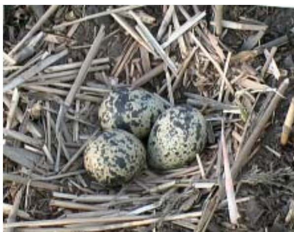
Töyhtöhyppän munapesä Kääppän eteläosan ruovikon niittoalueella 22.5.

Kuustonniityllä kaksi ja Kääppässä yksi pari. Lisäksi Vasikkahaassa oli reviirillä pari, joka hävisi jo toukokuun puolivälissä. Vasta toukokuun jälkipuoliskolla havaittiin pariin otteeseen Aarlahden puolella pesivän oloinen lintu lähinnä Aarlahden ja Niittyranan seuduilla. Lienee mahdollista että kyseessä olisi ollut alun perin Vasikkahaassa reviiriä pitänyt lintu? Kuovia ei todettu pesivänä alueen rantaniityillä vuonna 1994. Laajoen suistoon laji oli palautunut jo vuonna 2000 kahden parin voimin.