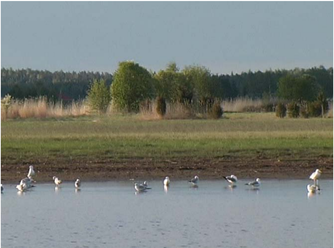
Sillankarin rantaviivaa on hoidettu äestämällä. Tulokset ovat olleet positiivisia.

Pesimälinnustolaskennat suoritettiin koko Natura-alueella. Natura-alueen kokonaispinta-ala on 507 ha, josta laidunalueita on n. 52 ha (Kääppä 29 ha, Kuusto 17 ha ja Tervoinen 6 ha), hoitoniittyä 52,5 ha, sekä vesialuetta ja ruovikkoa 389 ha. Alueeseen rajautuvia rantametsiä tai peltoalueita ei selvitetty tutkimuksessa.