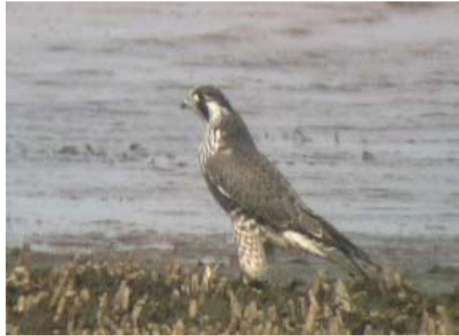
Nuori muuttohaukka Sillankarin lietteellä 13.9.2002.