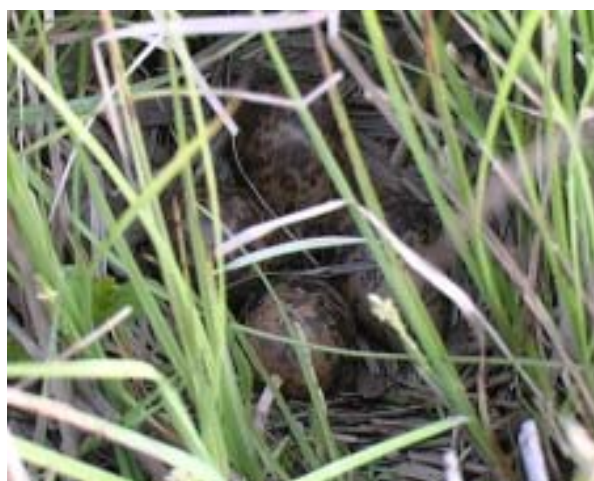
Taivaanvuohi pesii alueella melko runsaana. Munapesät löytyivät Tervoisten niityltä (10.5. neljä munaa) ja Aarlahdesta (15.5. neljä munaa ja edelleen 22.5.) . Kuva: Pekka Alho (Aarlahti)