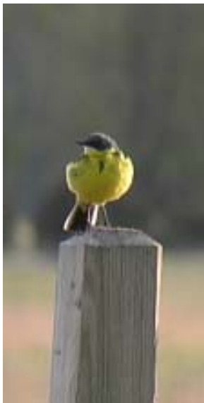
Keltavästäräkki reviirillään Kääppässä.

Sekä keltavästäräkin pesimäkanta että muuttajamäärät ovat vähentyneet 1960- ja 1970-luvun määristä (Lehikoinen & Gustafsson ym. 2003). Lahdella suoritettava kunnostustyö on lisännyt pesimäkantaa ja myös syyslevähtäjien määrä tuntuisi viime vuosien perusteella olevan kasvussa. Keltavästäräkit ruokailevat laajalti alueen niityillä ja pelloilla, mutta erityisesti Kääppä tuntui laskentavuonna vetävän lintuja. Linnut yöpyvät mm. jokisuun ruovikossa ja syksyn 2002 muutosta saadaan jonkinmoinen kuva pääskypynnin yhteydessä rengastettujen ja havaittujen lintujen määrän perusteella. Ruovikkorengastuksen mukaan muuton huippu oli jo 16.8, jolloin rengastettiin 29 lintua ja havaittiin yhteensä n. 100 lintua. Monilta aiemmilta vuosilta ei ole merkittäviä havaintoja keltavästäräkkien määristä ja havainnot koskevat korkeintaan muutamaa kymmentä lintua. Viime vuosina Mietoistenlahdelta on kuitenkin havaintoja suuremmistakin määristä. Enimmillään lintuja on laskettu kuitenkin 24.8.1996, jolloin lasketut 300 lintua havaittiin tosin peltoalueilla. Myöhäisin keltavästäräkki on nähty Aarlahdessa 18.10.1992. Laskentavuoden viimeinen havainto tehtiin ehkä hiukan keskimääräistä aikaisemmin 13.9.