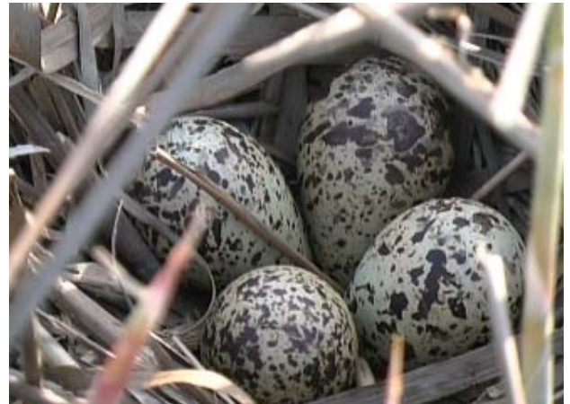
Punajalkaviklon munapesä, Kääppä 22.5.

Punavarpuunen ( Carpodacus erythrinus ) n. 10 paria Punavarpusia lauloi harvakseltaan koko alueella.