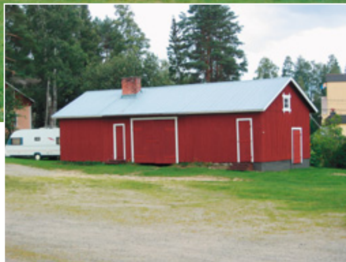
(Ylimpänä) Kunnostettu Työväentalo on saanut uuden ilmeen. (Vas.) Ulkovuorauksen lahot alaosat poistettiin ja tilalle laitettiin vaakalaudat. (Oik.) Työväen talon pihapiirissä olevan ulkorakennuksen vuoraus uusittiin ja rakennus maalattiin.