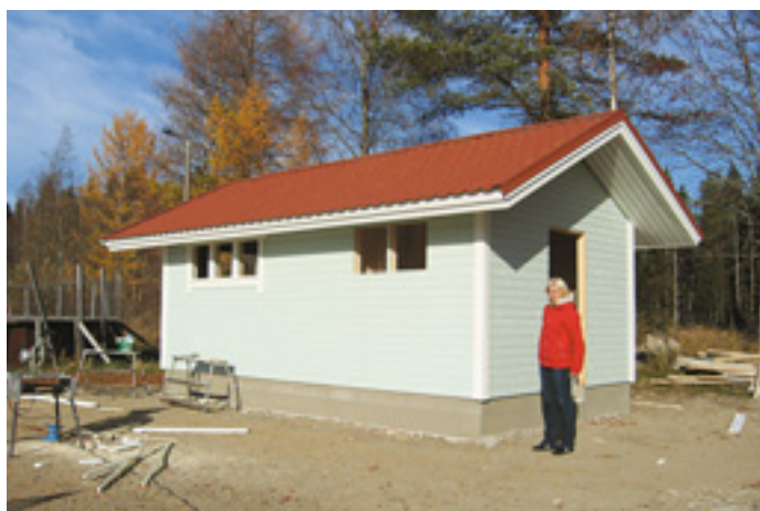
(Yllä) Luupuveden koulun pihaan valmistui varastorakennus. (Oik.) Möljän rantaan rakennettiin uusi laituri.