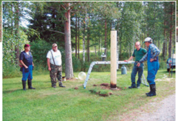
Rautavaaran Metsäkartanolla valopylväiden lahot puukuoret vaihdettiin uusiin. Lopuksi uudet pylväät tervattiin.