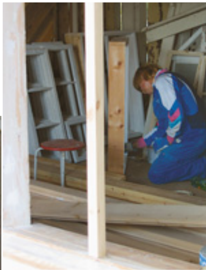
Pursiseuran huvilan ikkunoita kunnostetaan.

Iisalmen pursiseura on kunnostanut talkoovoimin Haukiniemessä sijaitsevaa Castrenin huvilaa. Kunnostaminen vaatii paljon talkootyötä, joten ikkunoiden ja ovien kunnostaminen katsottiin sopiviksi yty-työkohteiksi. Huvilan ovet, ikkunat ja kuistin kaide kunnostettiin ja maalattiin. Ulkorappuset uusittiin ja kuistin edustalle laitettiin kiveystä.