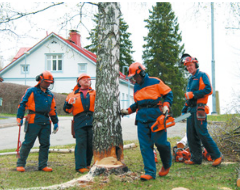
Puun kaataminen kaupunkialueella on tarkkaa työtä.

Iisalmen kotiseutumuseon ympäristöstä poistettiin puustoa ja avattiin näkymiä vesistöön. Metsää harvennettiin ja rantapolun pohja raivattiin museolta Paloisvirran sillalle. Lopuksi alue maisemoitiin. Kannot poistettiin ja paikalle ajettiin täytemaata, alue tasoitettiin ja nurmetettiin.