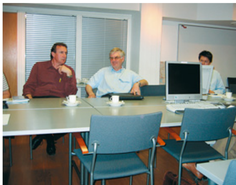
Ylä- ja Koillis-Savon rukkasryhmän kokous Kuopiossa.

Molemmissa rukkasryhmissä käytiin läpi projektin tilannekatsaukset ja käsiteltiin projektiin varatun suunnittelurahan käyttöä.