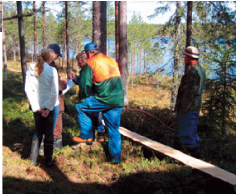
(Ylimpänä) Suomäen partiolaisten majalle vievälle polulle tehtiin pitkospuita lähes 500 metriä. (Vas.) Materiaalia pitkospuiden rakentamiseen saatiin polun varrelta. (Oik.) Polun linjausta tarkastetaan yhdessä.