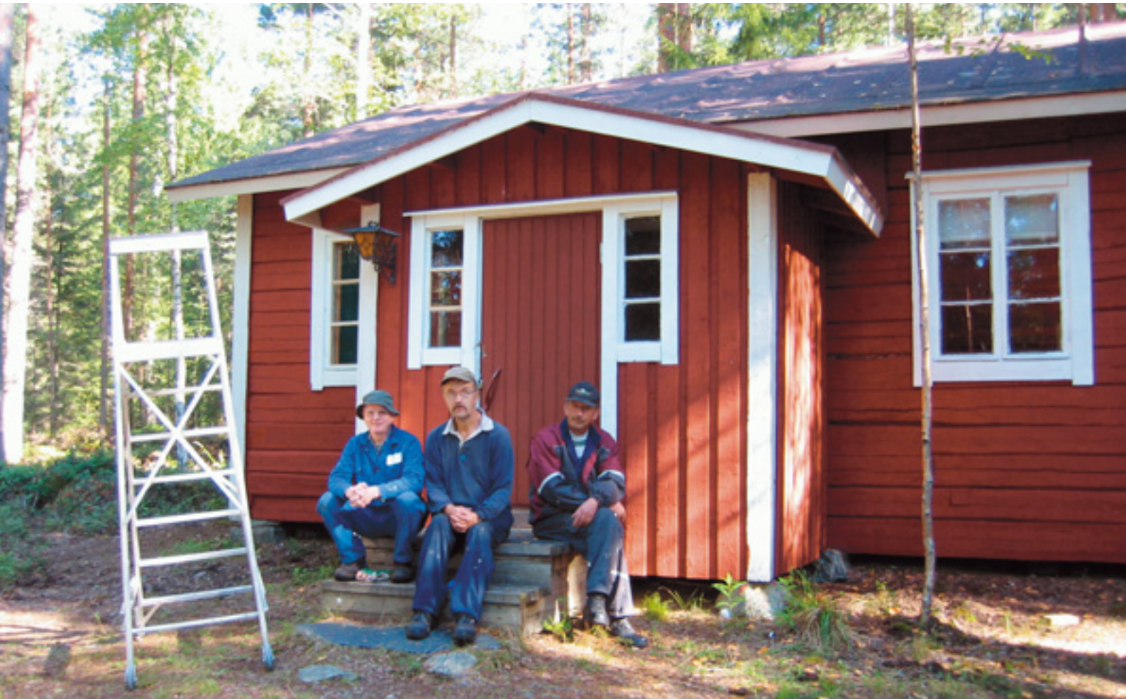
(Ylimpänä) Konnuksen kanavan alueella olevien proomujen alaosat tervattiin. (Yllä) Majoitusmökkin ikkunat kunnostettiin ja rakennus maalattiin.

Konnuksen kanavalla tervattiin proomujen Sanelma ja Iina alaosat. Kanavan alueella oleva mökki maalattiin punamultamaalilla ja kitattiin ik-