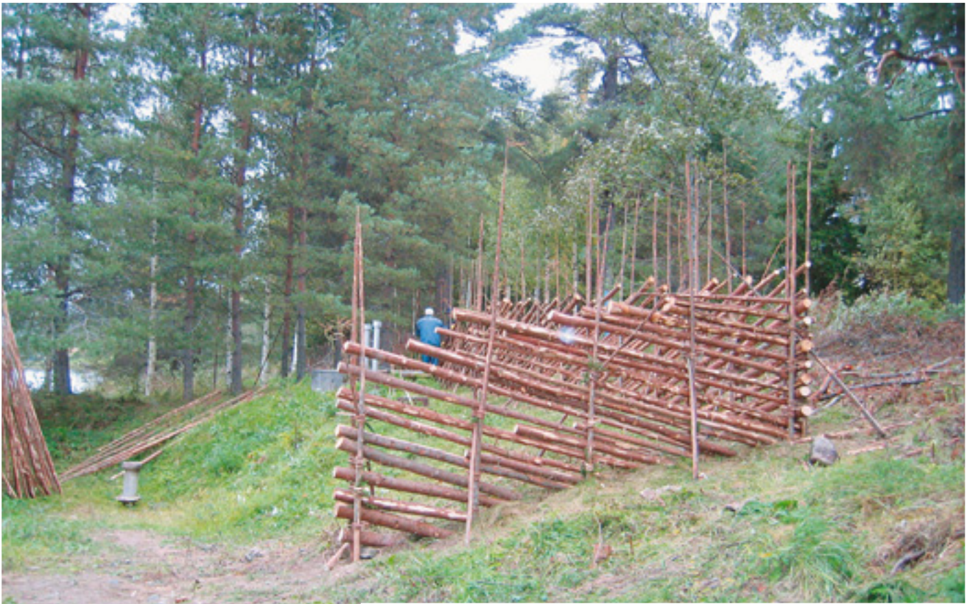
Vanhan vedenottamon ympäristö siistittiin korvaamalla huonokuntoinen verkkoaita pisteaidalla.