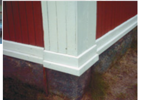
(Ylh.) Rautalammin työväentalon julkisivut kunnostettiin. Valok. Esko Karvinen. (Vas.) Nurkkalaudat ennen kunnostusta. Valok. Esko Karvinen. (Oik.) Ja kunnostuksen jälkeen. Valok. Esko Karvinen.