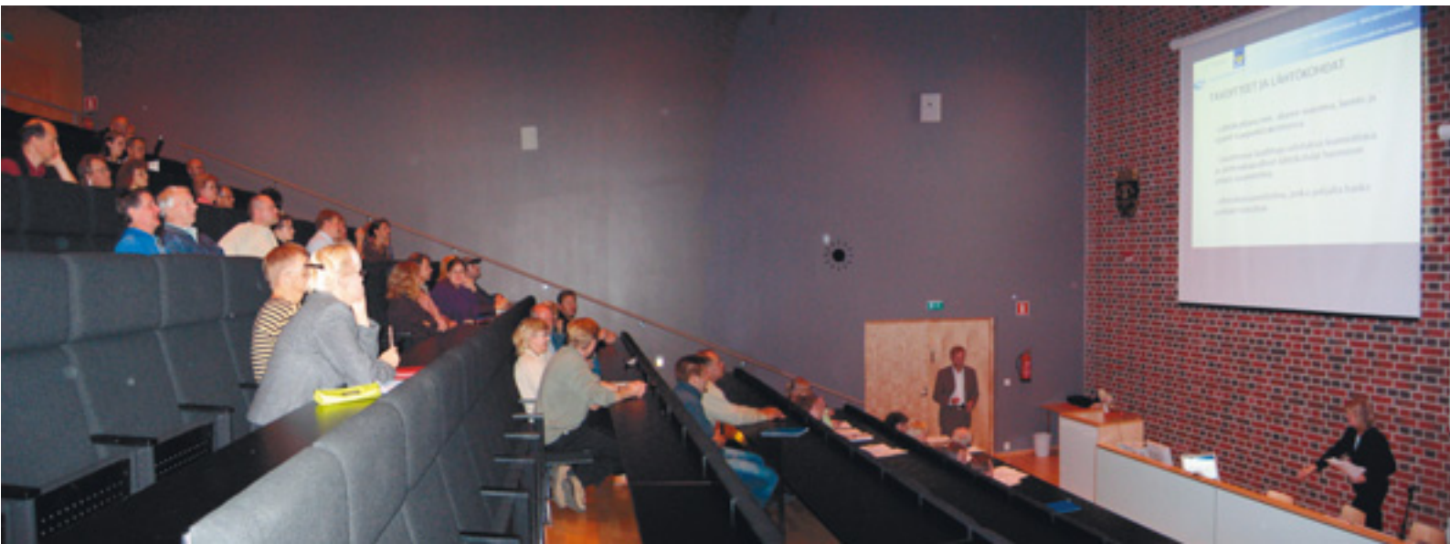
Iisalmen Luuniemen asuntoalueen ympäristösuunnitelman esittely kiinnosti iisalmelaisia.