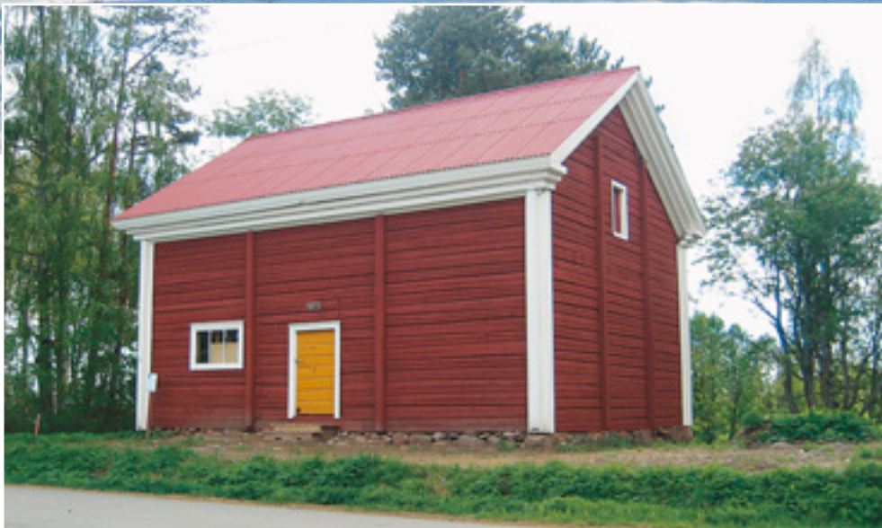
(Ylh.) Maaningan viljamakasiini talvisessa asussaan ennen kunnostusta.