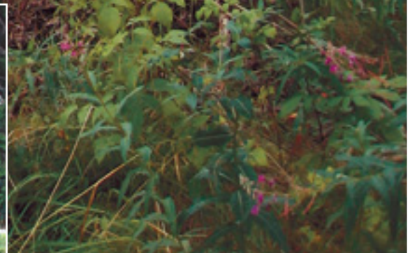
(Ylh.) Työmaataulu kertoo pururadan raivaustyöstä. (Vas.) Hiihtomaan alueelta raivattiin risukkoa.