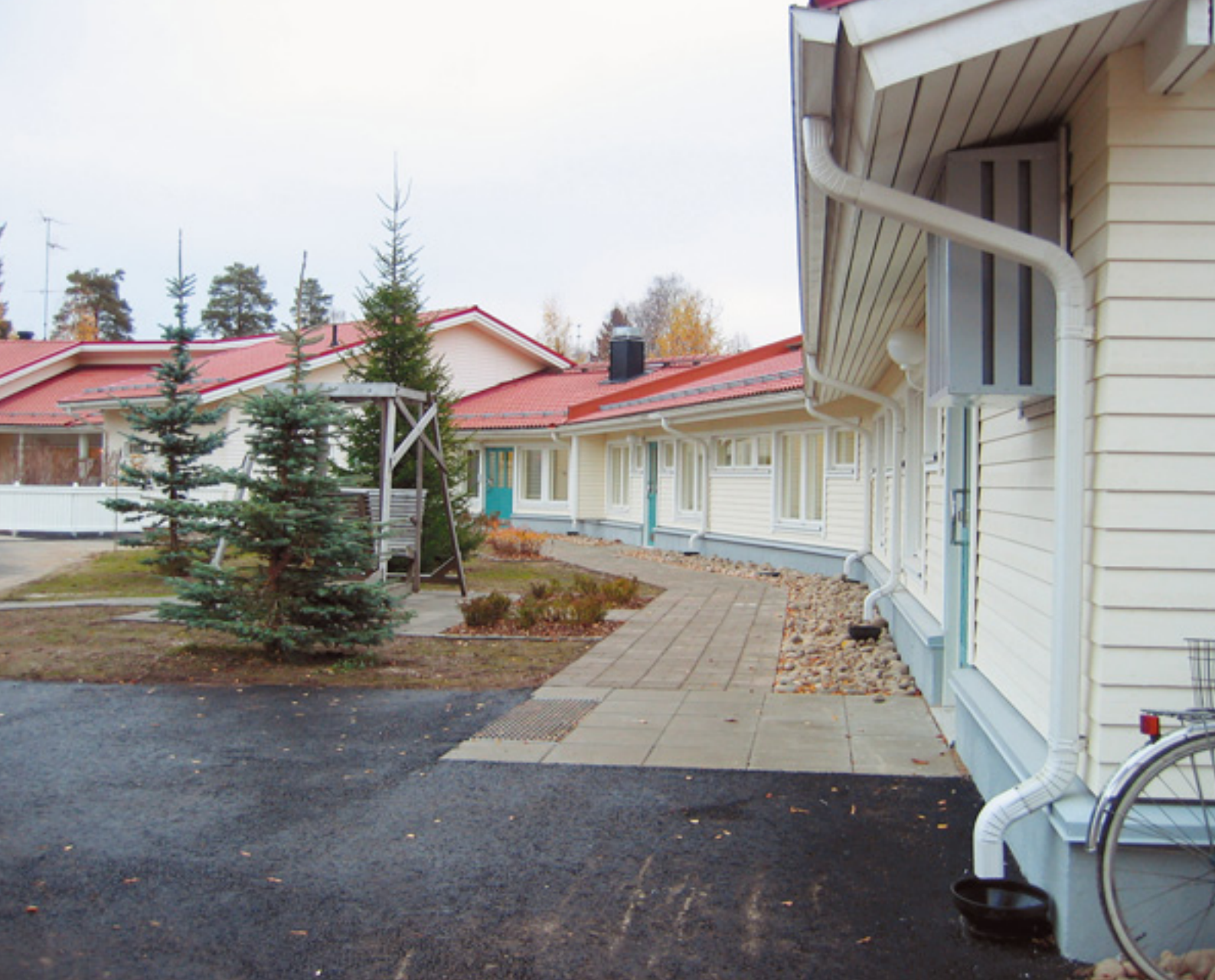
Palvelutalo Pauliinan piha-alue kunnostettiin ja kulkuväylille laitettiin betonilaatoitus.