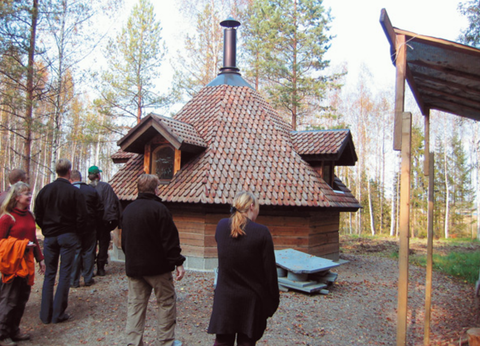
Keski-Suomessa tutustuttiin Saarijärvellä yty-työnä tehtyyn Lautajärven kotoon.