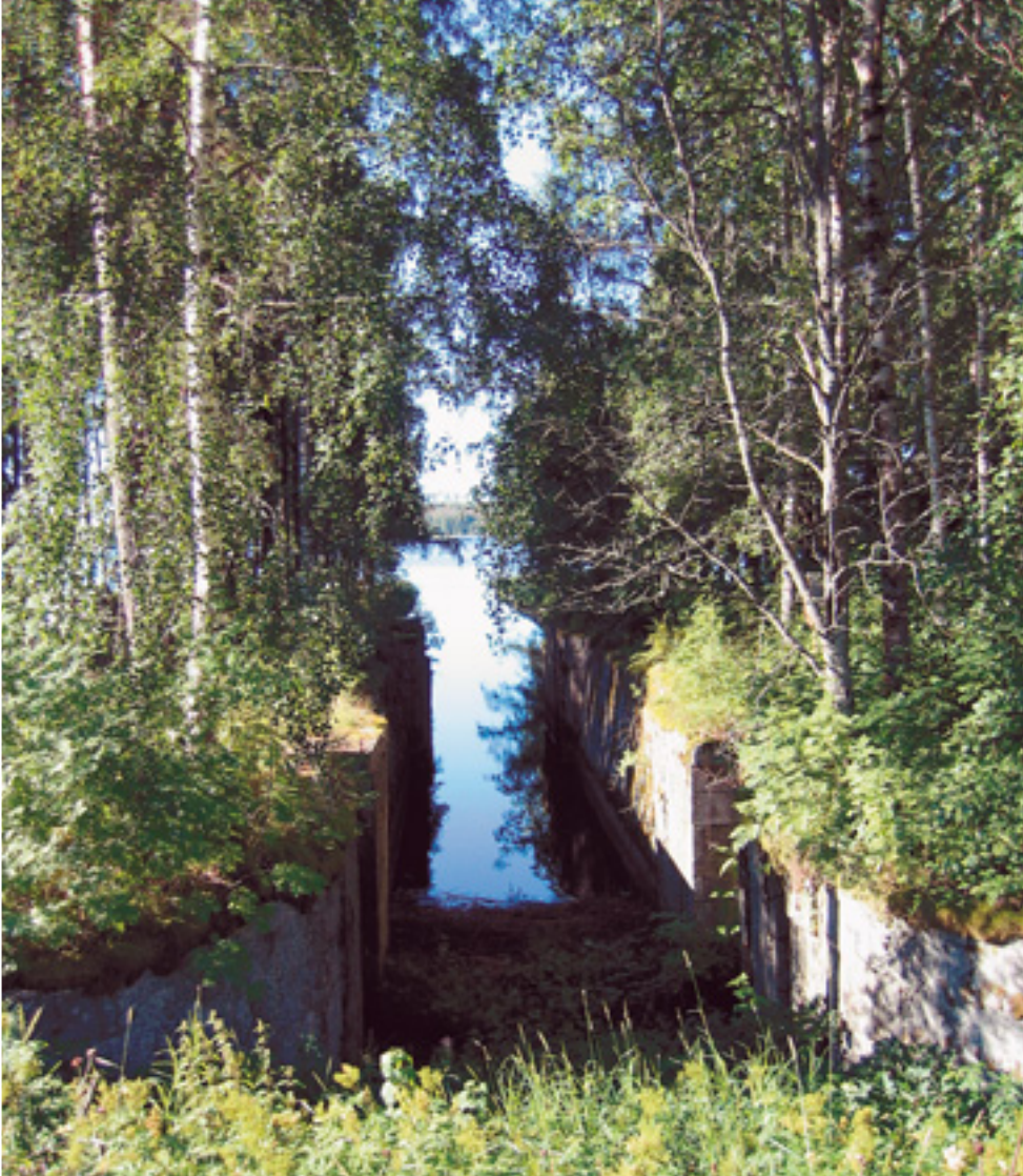
(Vas.) Maaningan Viannan vanhan kanavan maisema oli ennättänyt pusikoitua ja puustottua. (Alh.) Raivaustyön tuloksena avautui kaunis järvimaiesema.