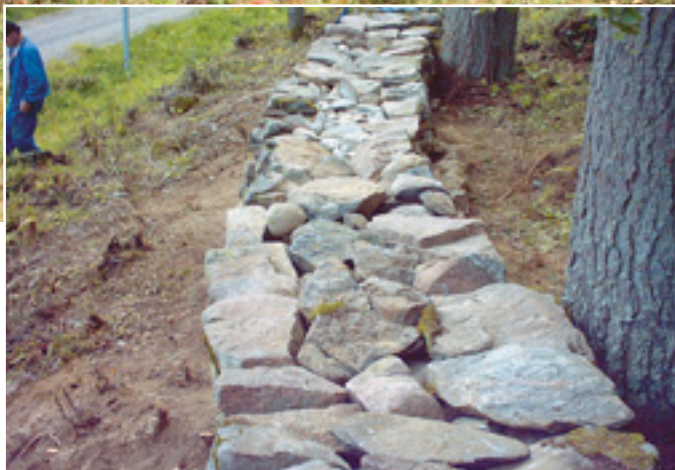
(Kuvat ylhäällä ja vasemmalla) Rautalammin kirkon ympärillä oleva kiviäitää kunnostettiin ja ympäristö raivattiin. (Vasemmalla alhaalla) Kirkon kiviäitää ennen kunnostusta.