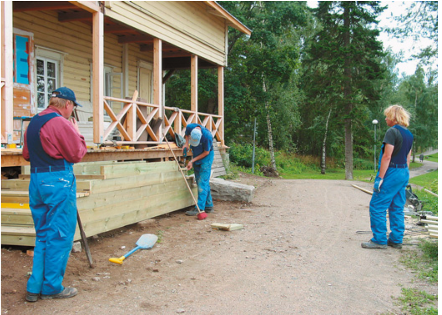
Yty-työmiehet rakensivat pурсiseuran majalle uudet portaat.