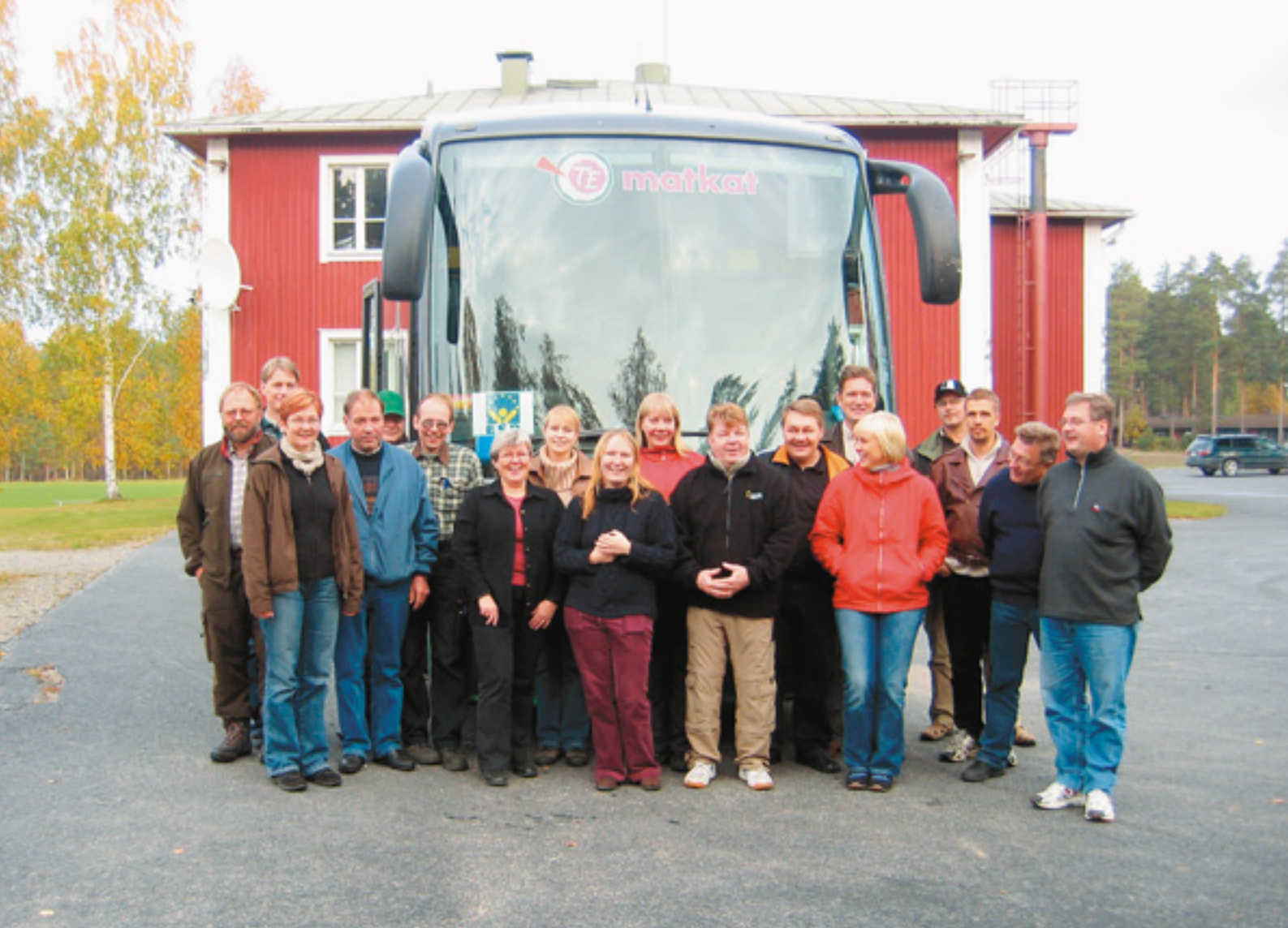
Keski-Suomen ja Pohjois-Savon Yty-projektien henkilöstöä ryhmäkuvassa Tervossa.

Projektilla on omat verkkosivut, www.ymparisto.fi/psa/yty . Sivujen päivityksestä ovat vastanneet projektipäällikkö ja projektisihteeri yhdessä viestintäyksikön kanssa. Osa kunnista on linkittänyt projektin kotisivut omille sivuilleen.