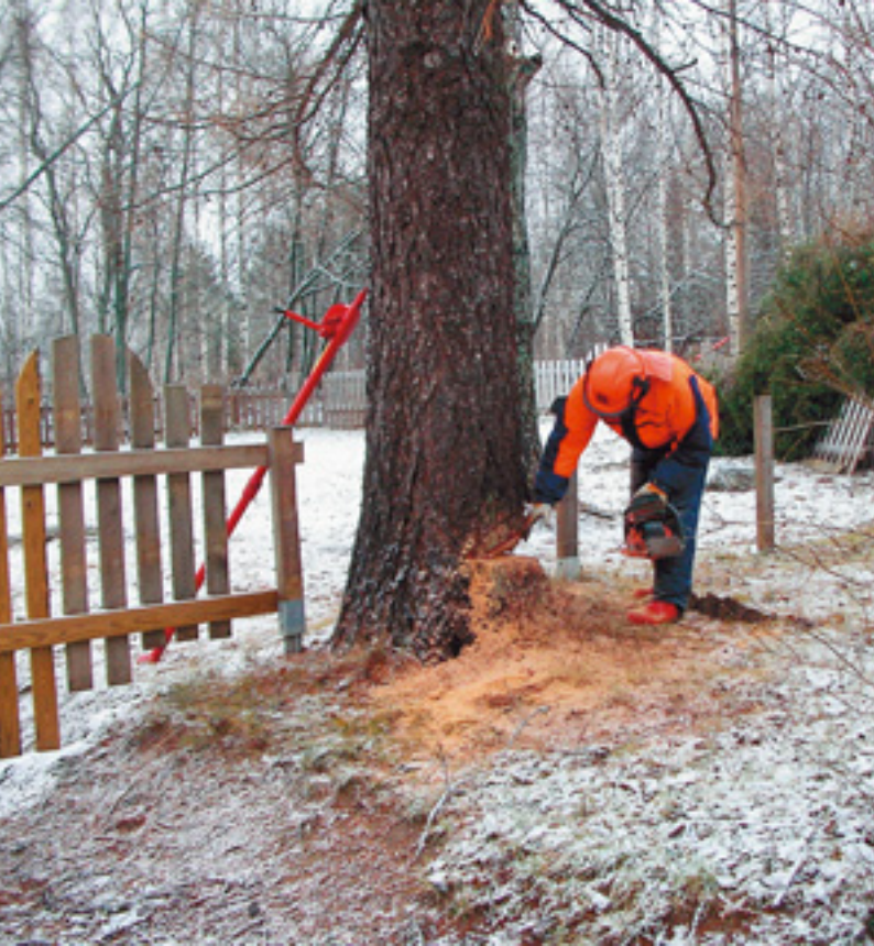
(Yllä) Vaarallisia puita kaadettiin kylän alueelta. Valok. Kari Julkunen. (Ylhäällä oikealla) Koulun ympäristöstä poistettiin puustoa. Valok. Kari Julkunen. (Keskellä oikealla) Ranta-alueita raivattiin eri puolilla kuntaa. (Alhaalla oikealla) Leikkipaikkoja kunnostettiin ja ympäristöä siistittiin.