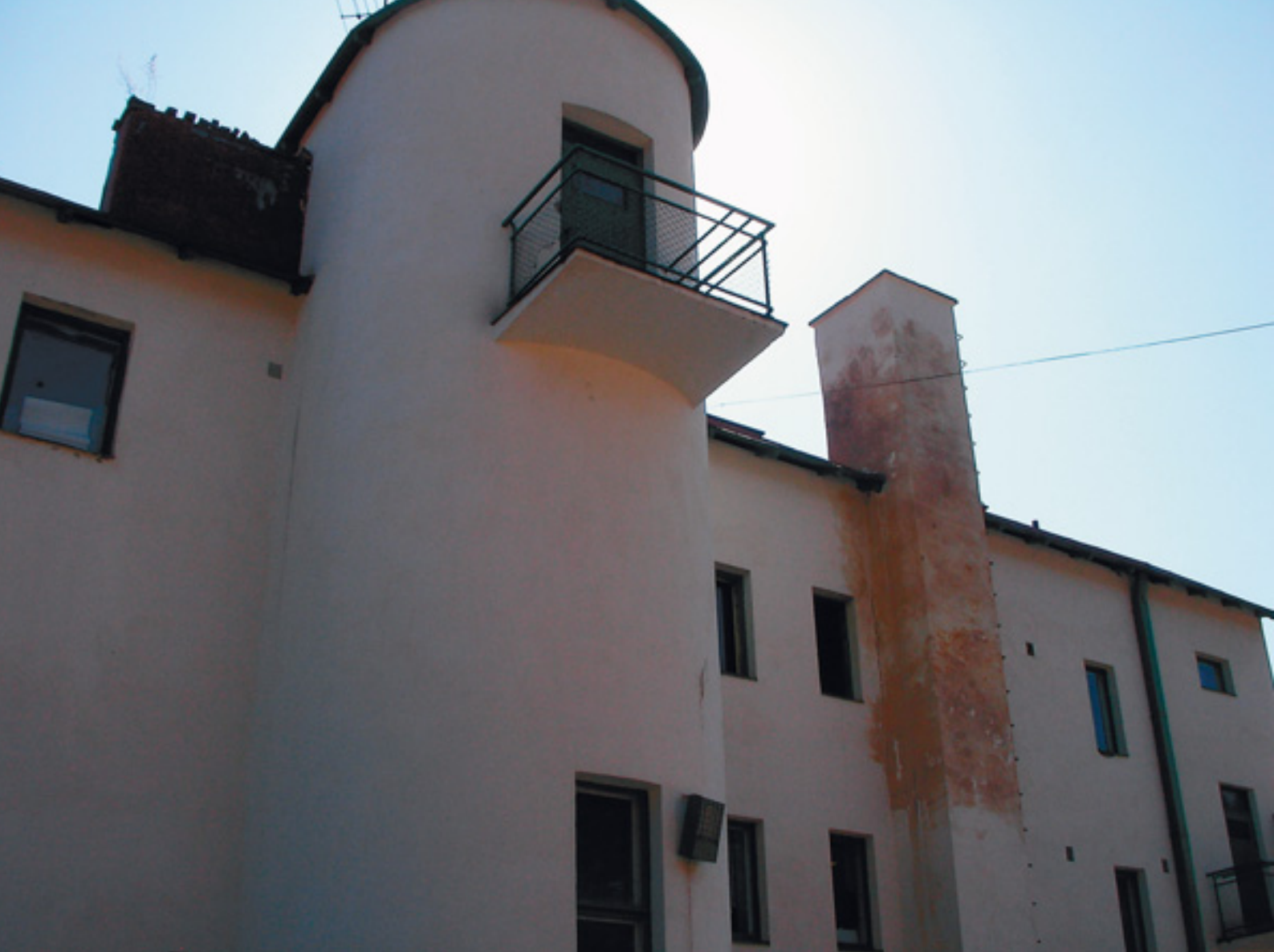
Entisen osuuskaupan piipun uusi rappaus erottuu tummempänä pintana.