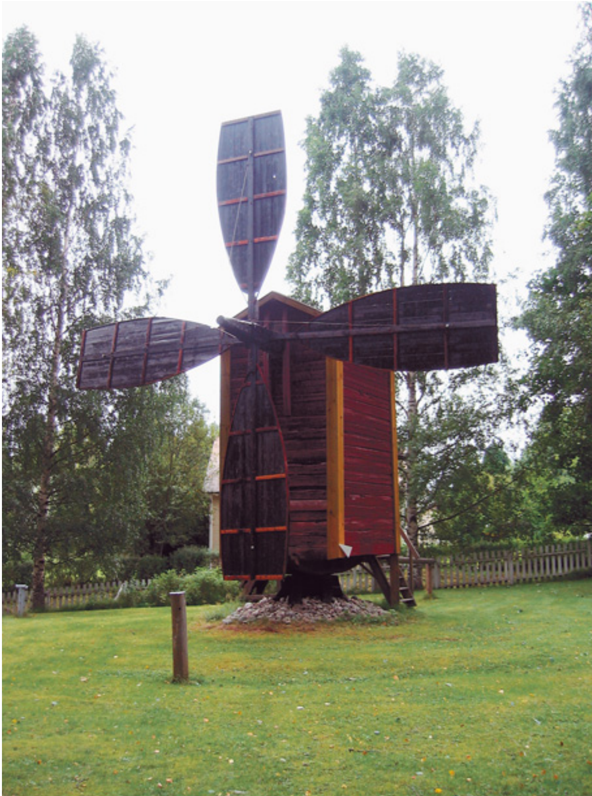
Peuran museon tuulimyllyn tehtiin uudet siivet. Siivet tervattiin ja asennettiin paikoilleen.

Peuran museon pihapiirissä olevaan tuulimyllyn tehtiin uudet siivet, jotka tervattiin ja asennettiin paikalleen.