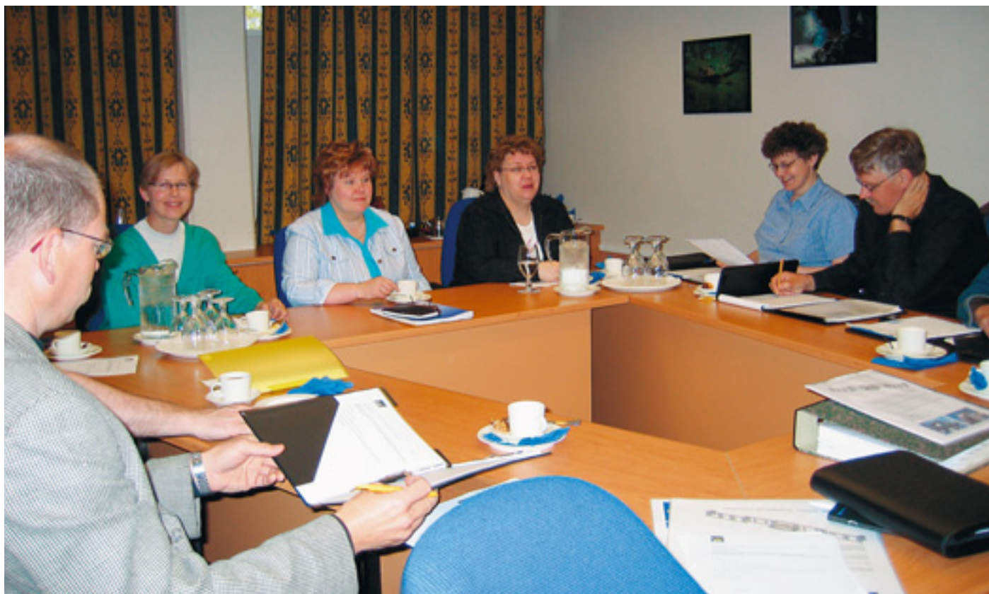
Sisä-Savon, Kuopion ja Varkauden seudun rukkasryhmä kokoontui Leppävirralla.