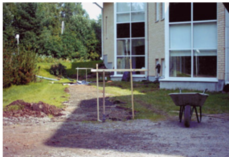
Nuorisotilan sisäänkäynnille tehtiin betonilaatoitus.

Palvelutalo Pauliinalle tehtiin sadevesijärjestelmä. Uusi nurmialue tasattiin ja kylvettiin nurmikolle. Lisäksi istutettiin puita, pensaita ja perennoja. Pihalle ja keinin alle tehtiin betonilaatoitus sekä valettiin jätekatoksen pohja.