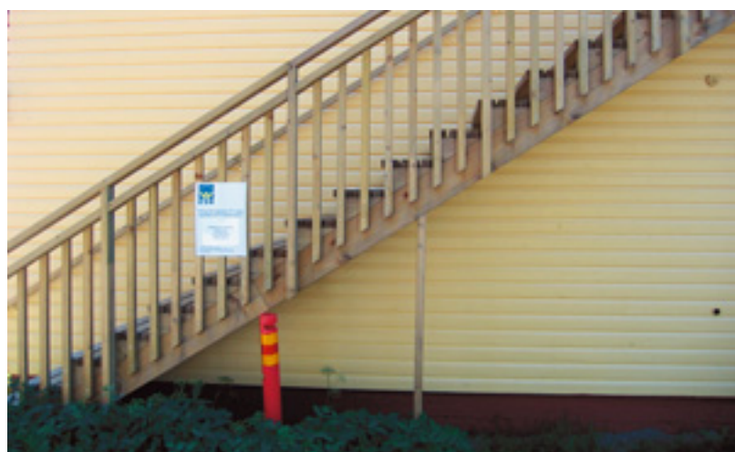
Projektin näkyvyyttä edistettiin työkohteisiin sijoitetuilla infotauluilla.