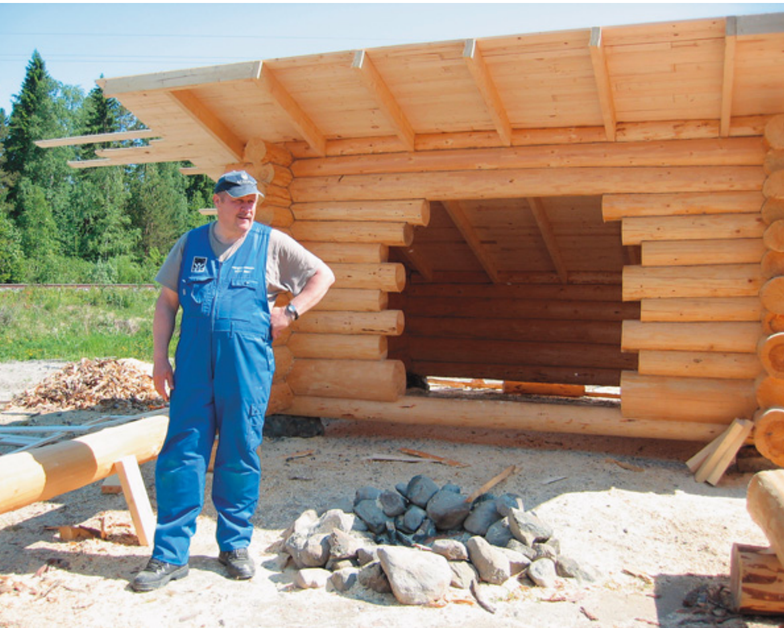
Kiuruveden Lapinniemen laavu rakenteilla.