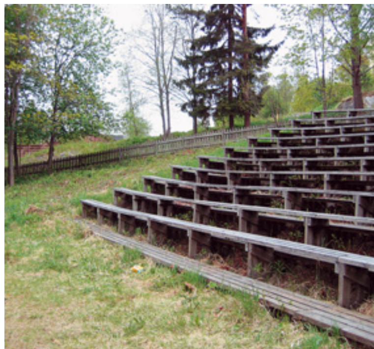
Kesäteatterin penkit kaipaavat kunnostusta.

Muita pienimuotoisia töitä olivat mm. kevyenliikenteen väylän ja rivitalon välisen aidan teko ja asennus.