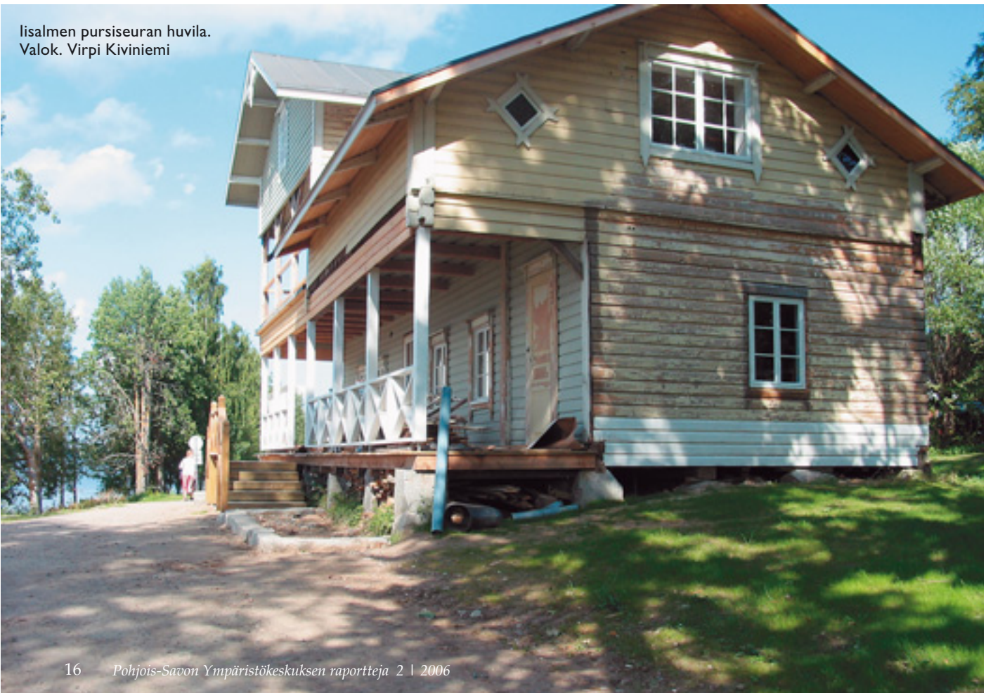
lisalmen pурсiseuran huvila.