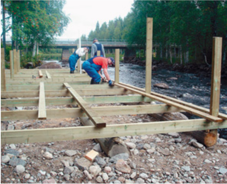
(Ylh. ja oik.) Koirakosken invalaiturin rakentaminen on alkuvaiheessa.