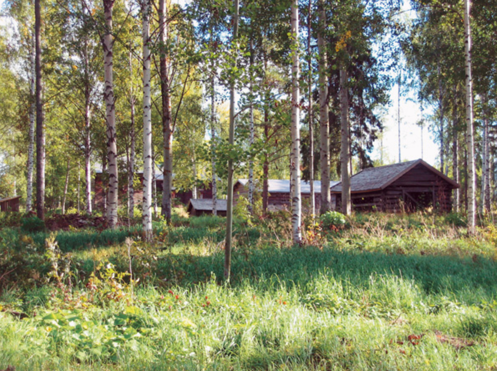
Kotiseutumuseon ympäristöä kunnostettiin raivaamalla vesakkoa ja avaamalla näkymiä järvelle.