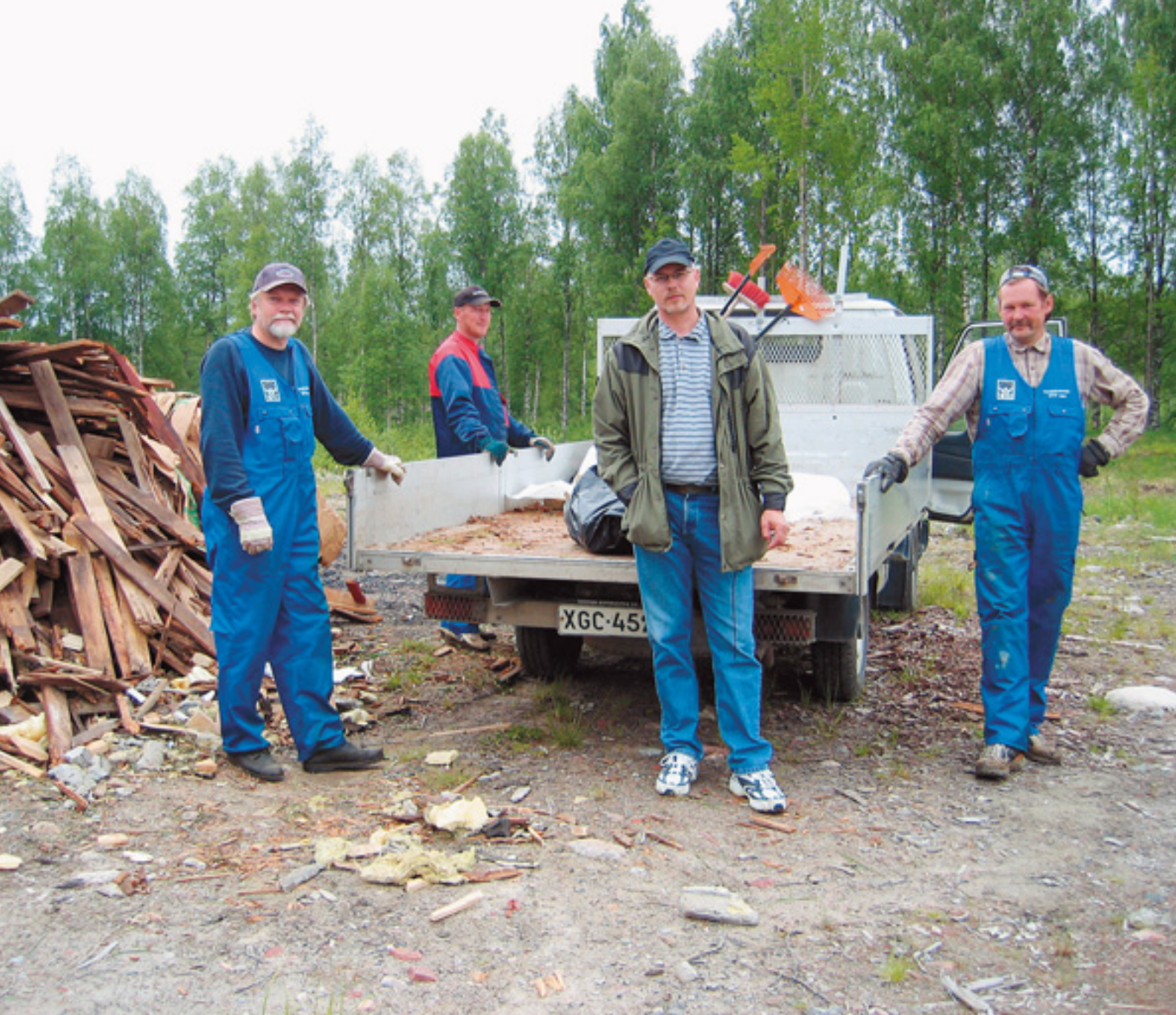
(Ylh.) Syvänniemien ympäristöä siistittiin juhannuskuntoon. (Oik.) Syvänniemellä osallistuttiin kivi-navetan katon kunnostustöihin.