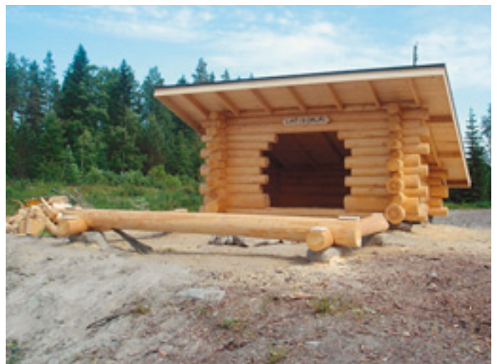
Lapinniemen laavu ja nuotiokehä valmiina.

Monitoimireitin varteen rakennettiin laavu. Polkuja viimeisteltiin ja laitettiin polulle tarkoitetut, valmiiksi tehdyt siltarakenteet paikoilleen. Lisäksi istutettiin taimia ja laitettiin opastauluja. Luontopoluille laitettiin pitkospuita. Luupujärven lintuornilta poistettiin liikuntaesteet.