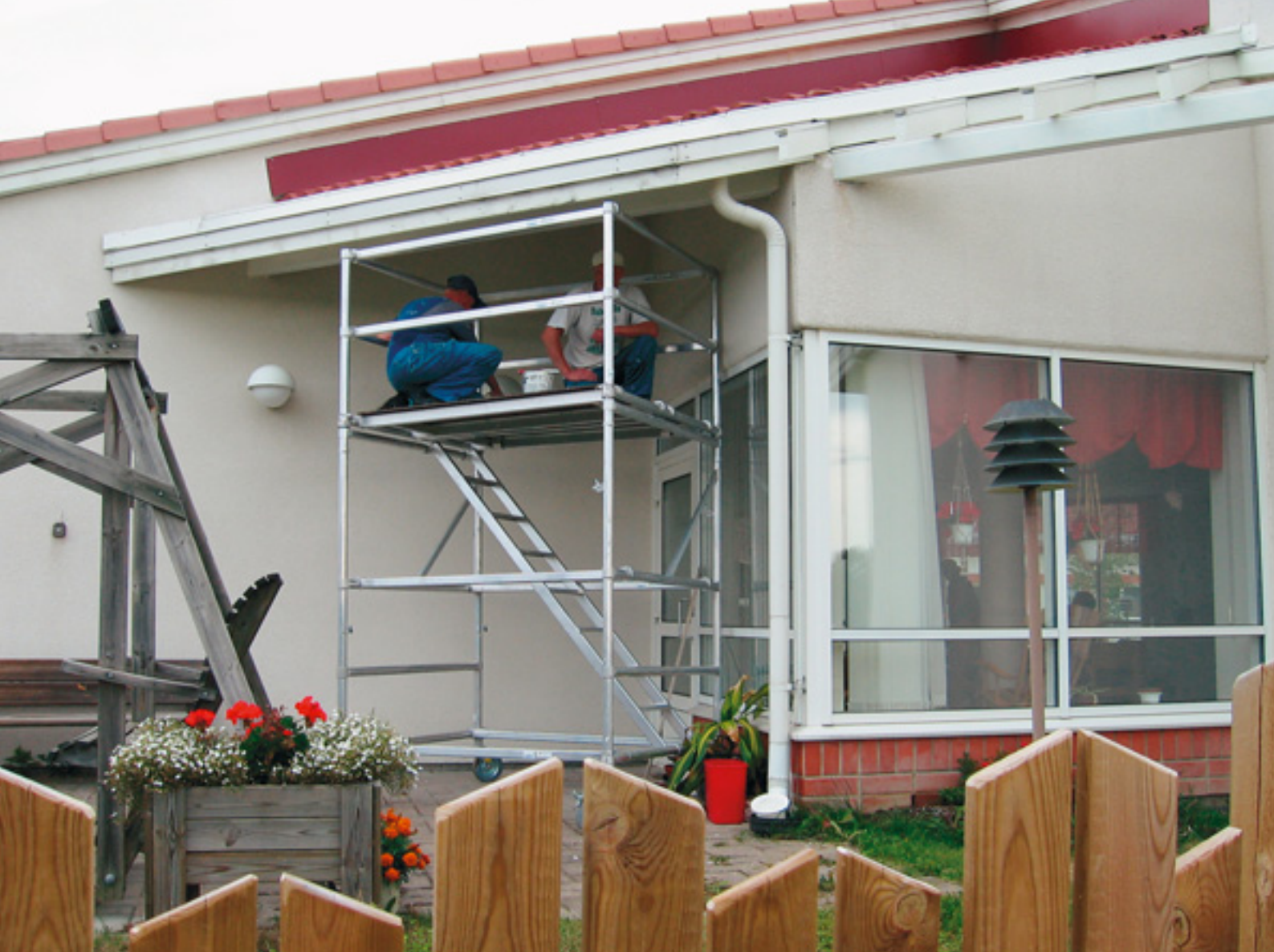
Kaavin palveluasuntojen kattojen ja terassien rautapalkkien maalaus onnistui myös sateella.