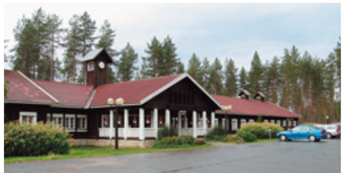
Metsäkartanon päärakennuksen seinät tervattiin. Samalla kuistin lahot puuosat vaihdettiin uusiin ja maalattiin.

Ulkoilualueita kunnostettiin ja valaistun reitin siltä korjattiin.