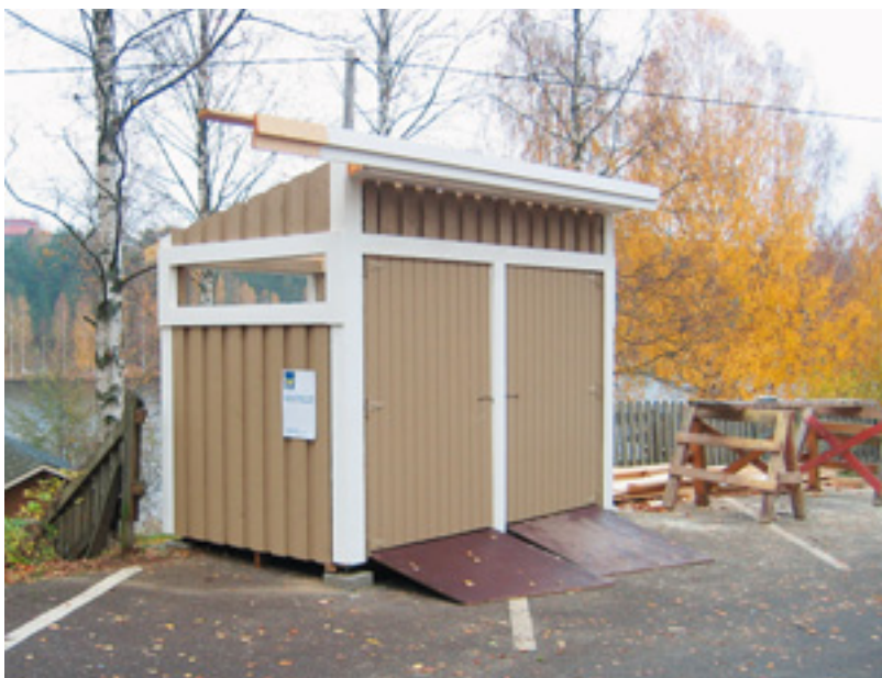
Roskakatos rakenteilla Mansikkaharjun leirintäalueella.

Mansikkaharjun leirintäalueella maalattiin lomamökit, huoltorakennus, varastorakennus ja grillikatot. Samalla korjattiin kattoja ja portaita sekä tehtiin hiekkalaatikko lapsia varten. Lisäksi rakennettiin jätekatot sekä tehtiin uusi pohja paikalle siirrettävää varastorakennusta varten.