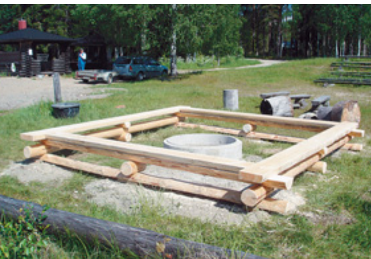
Koirakosken nuotio paikka valmiina.

Latuverkostoa kunnostettiin raivaamalla valaistun ladun reunavesakkoa ja levittämällä reitille haketta. Elekon reittiä raivattiin ja Sonkakosken valaistulla ladulla tehtiin raivaustöitä ja suoristettiin valopylväitä. Samoin kunnostettiin kelkkareittien siltoja.