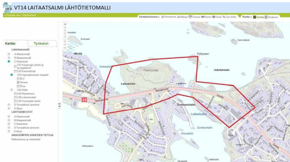
Kuva 2 VT14 Laitaatsalmen lähtötietoaineiston katselu- ja latauspalvelu. Kukin aineisto erikseen tai vaihtoehtoisesti koko aineisto kerralla voidaan valita ja ladata.