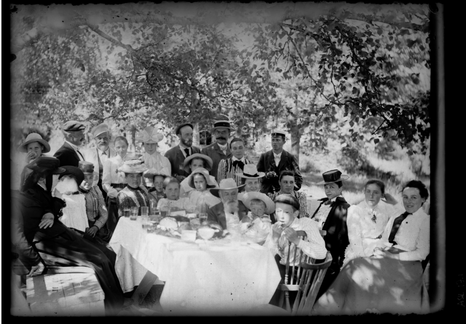
Hugo Simberg 1902, Kansallisgalleria