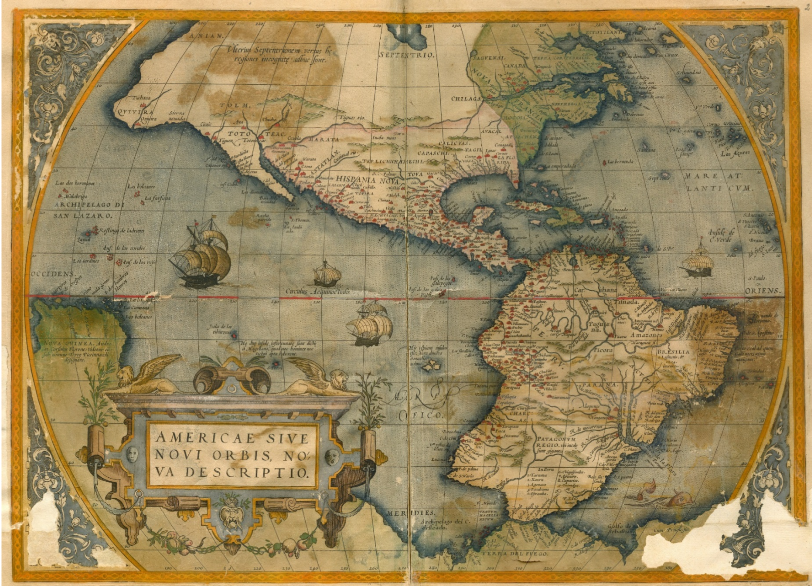
Abraham Ortelius 1574