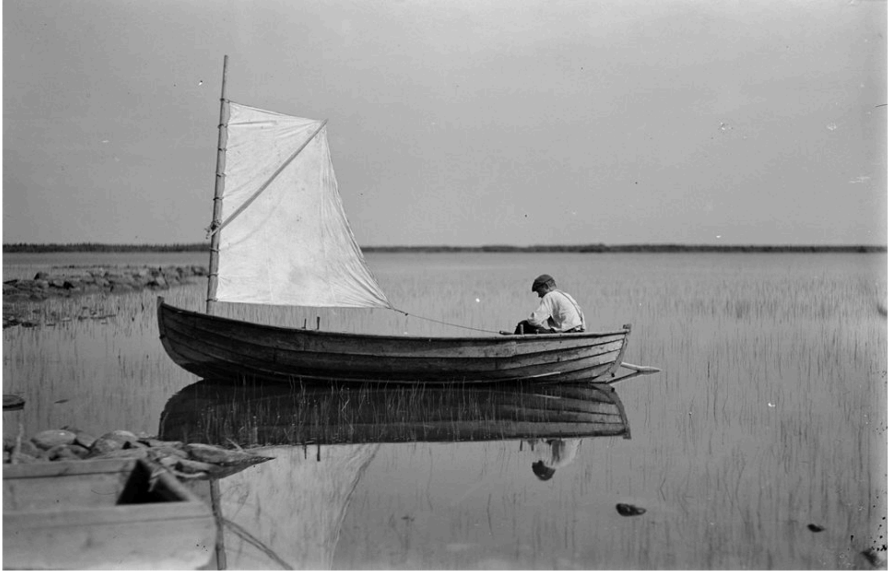
Knoparbåt 1930, Svenska litteratursällskapet i Finland