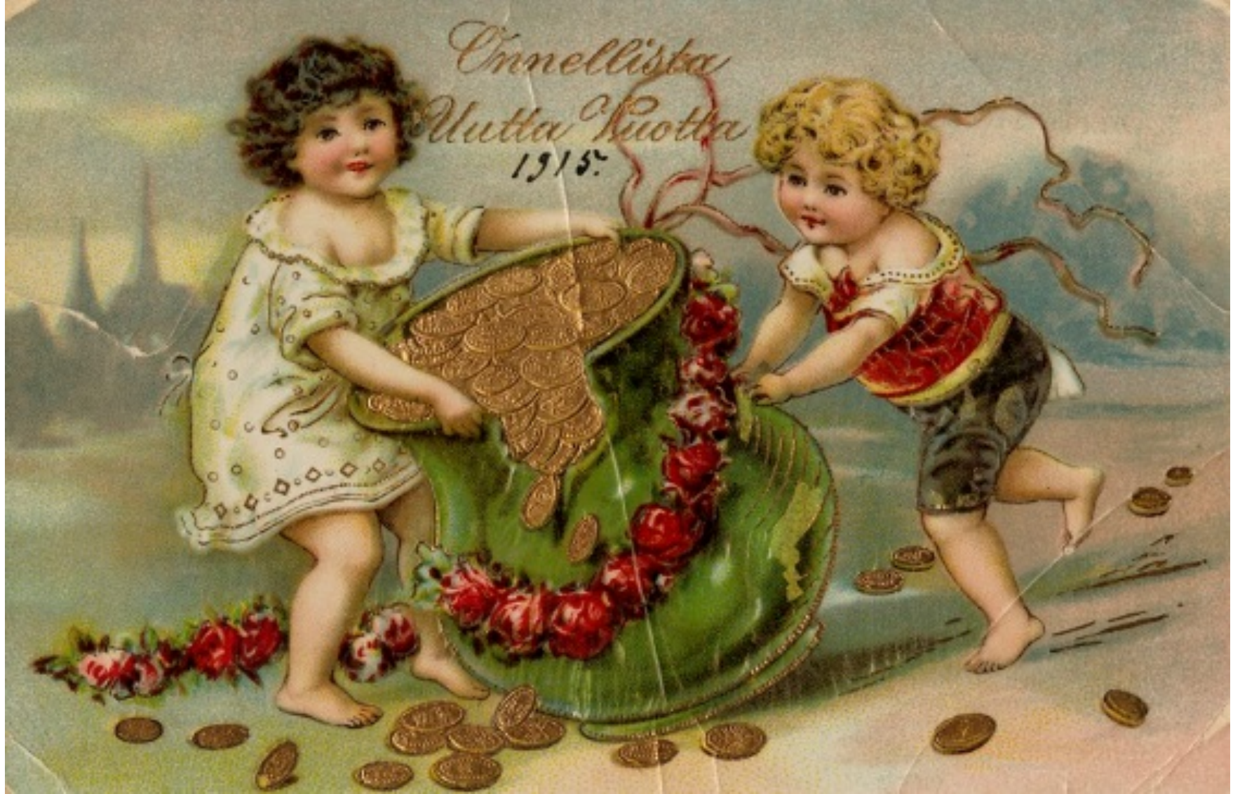
Postikortti 1915