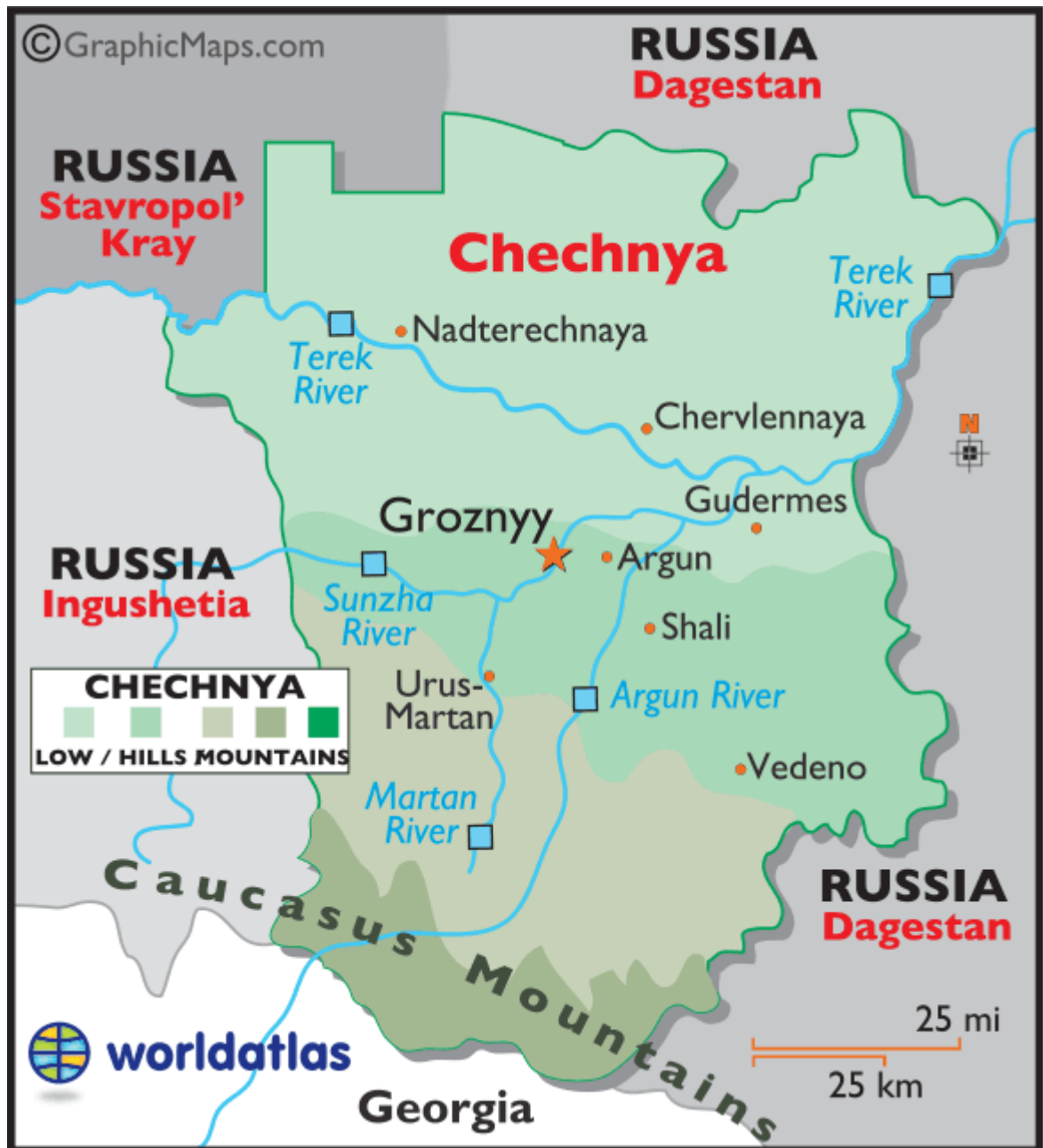
Liite 1. Tshetshenian kartta ( www.graphicmaps.com , 29.1.2015)