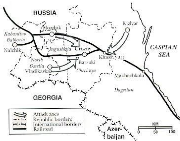
Liite 2. Venäjän hyökkäyssuunnat ( www.globalsecurity.org )