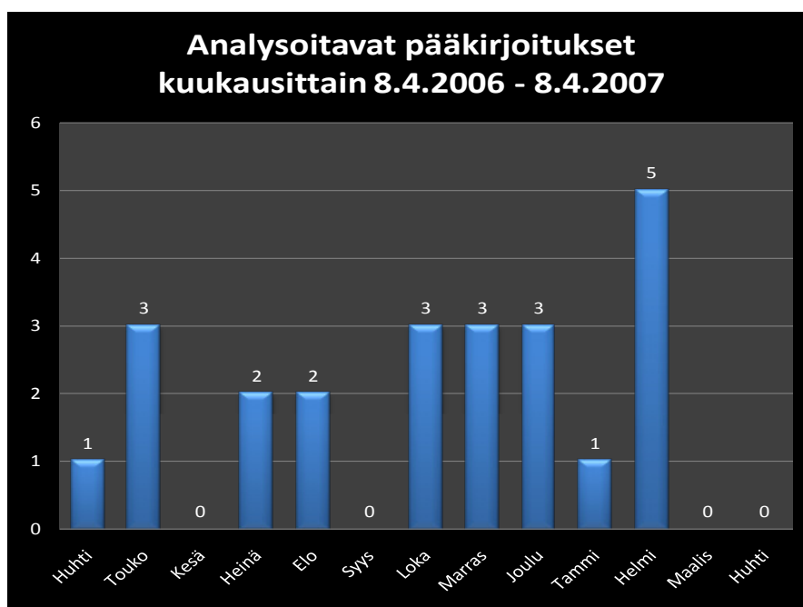
Kuva 2. HS pääkirjoitusten lukumäärät tarkasteltavana ajanjaksona on esitetty kuvassa.