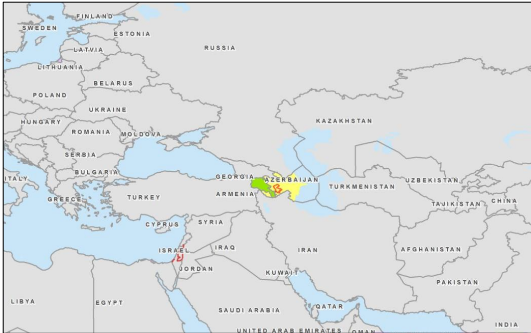
Kuva 1. Etelä-Kaukasian alue ja Vuoristo-Karabahin sijainti

pienemmän alueen hallinnasta (BBC 2012, www). Alue on useaan otteeseen eri yhteyksissä tunnustettu alueellisesti kuuluvan juuri Azerbaidzhaniin (Kruger 2010, 116 ). Alueen hallinnasta käytävää kamppailua on kutsuttu myös Armenian ja turkkilaisten väliseksi konfliktiksi.