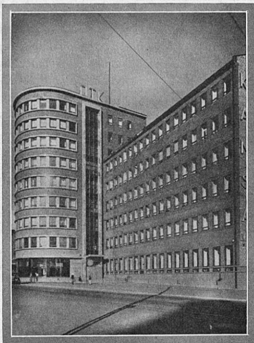
OTKn hallintotalo Hämeentie 19.

OTKn vaatetusteh- tainten valmisteita saadaan Elannosta