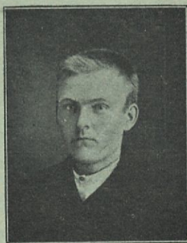
Kirjoittanut M. E. Mäki.