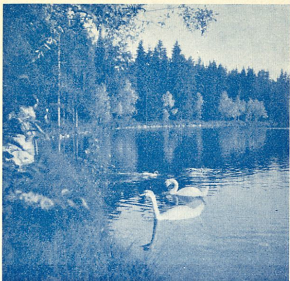
Aulanko, joutsen- lampi.