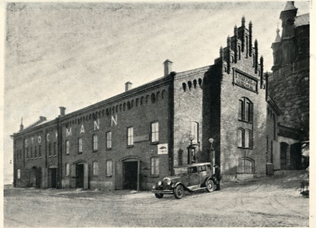
Exteriör av Stockmanns Bil-Monteringshall å Skatudden, Kanalgatan 3.

För att bilen skall prestera de bästa köregenskaper vid minsta möjliga bensinförbrukning är det av vikt, att för-gasaren, hjulen och bromsarna äro rätt inställda. Anlita oss för en justering.