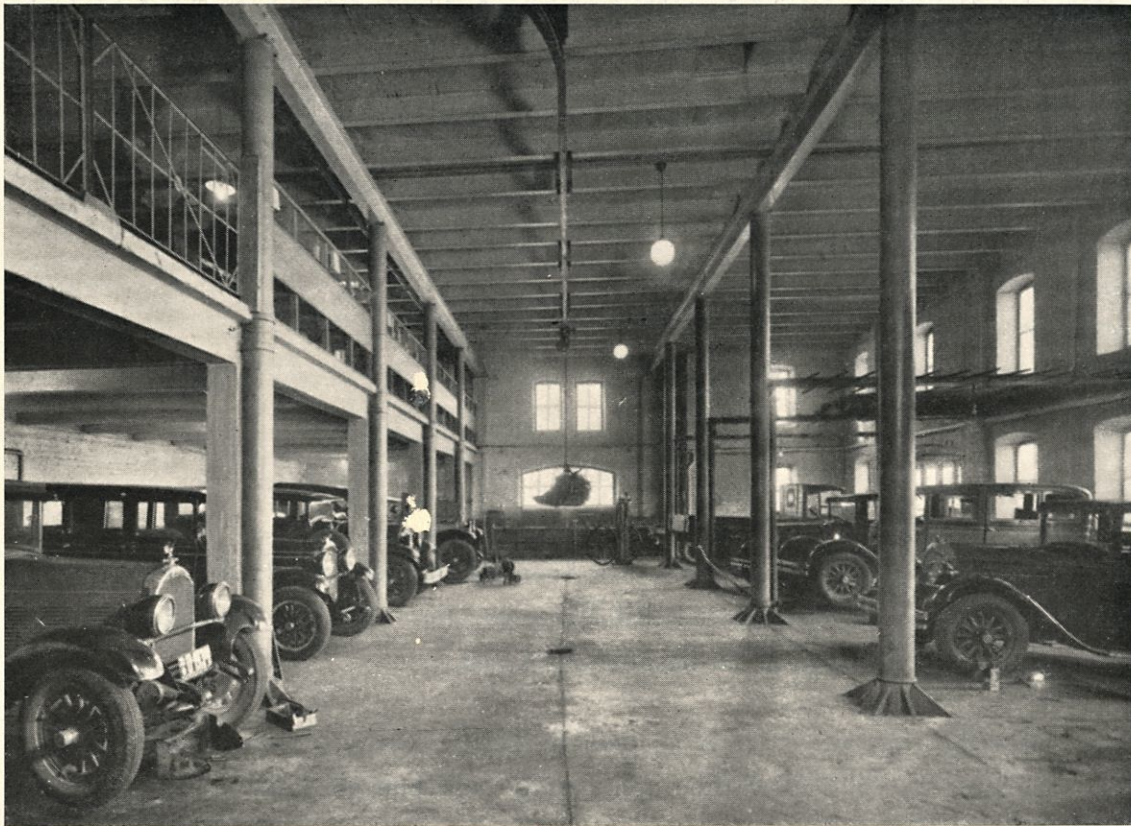
Den ljusa och rym- liga hallen. I taket transportbana för motorernas förflytt- ning till monterings- verkstaden uppe på galleriet.