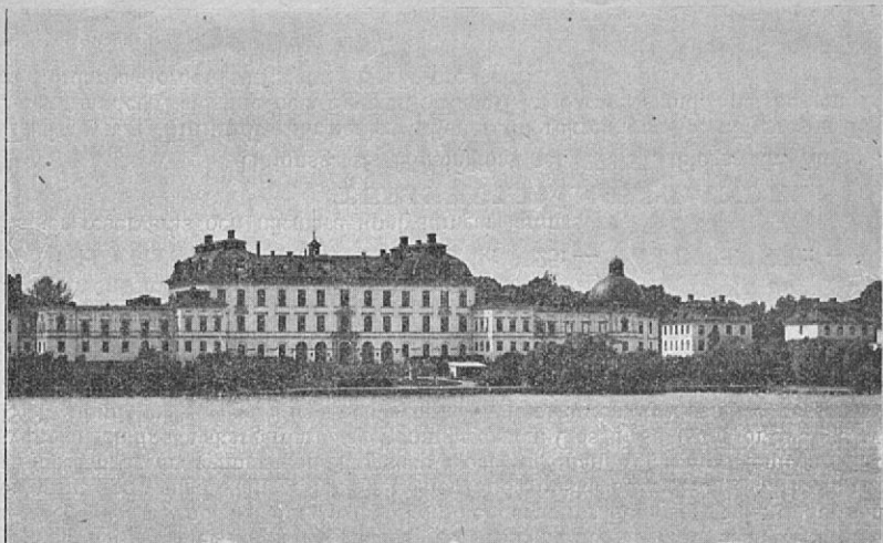
Drottningholm lähellä Tukholmaa.