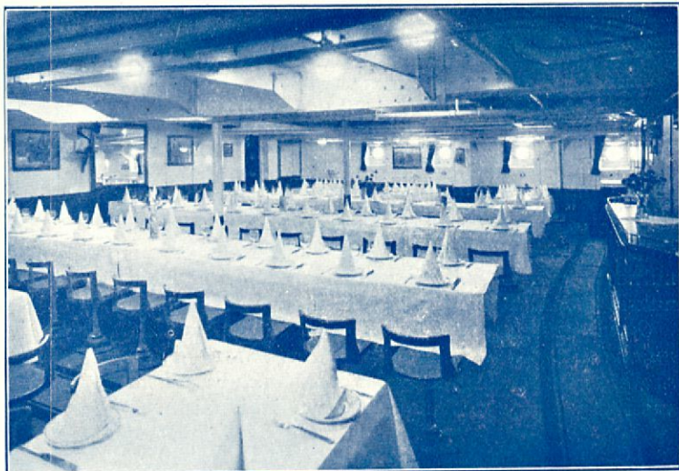
S/S „Oberon“ III:n luokan ruokasali.