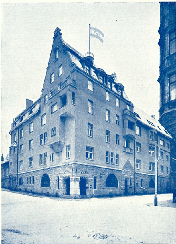
Suomen Höyrylaiva Osakeyhtiön toimitalo Helsingissä.