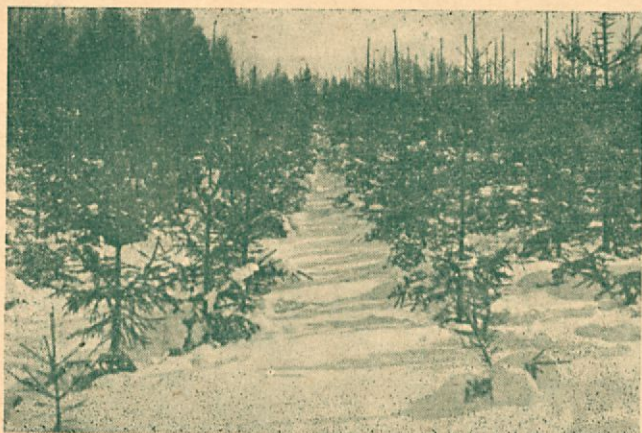
Tällaisia kuusinuorennoksia meiltä puuttuu. Paljaasihakkausosalalle istutettu, 11-vuotias kuusentaimitus.

Epätaloudellista puuta kasvavia metsiä on muitakin. Toininaan arvokaskin puulaji on tullut sille sopimattomalle kasvupaikalle, kuten kuusi ja haapa kuivalle kankaalle, toisinaan varsinaisissakin metsissä on sellaisia kohtia, joissa puusto on teknillisesti heikko, joko vähäärvoisen puulajin tahi oksaisten tai lahovikaisten puiden muodostama.