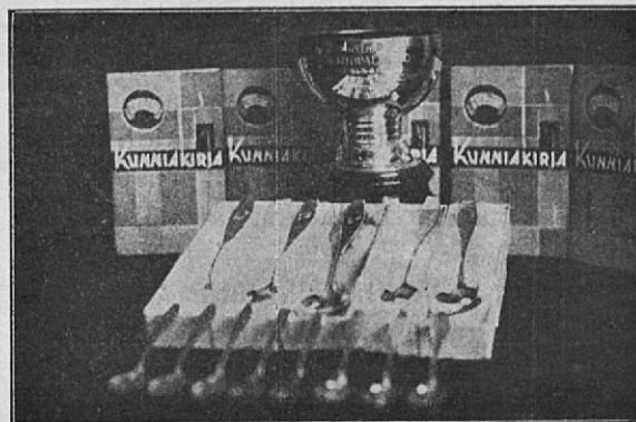
Seuran palkintokokoelmat 1931.