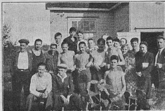
Seuran jäsenistö Majalla