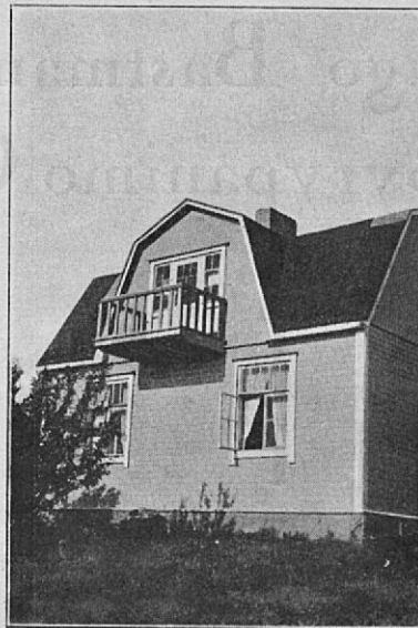
Seuran maja Tikkurilassa.