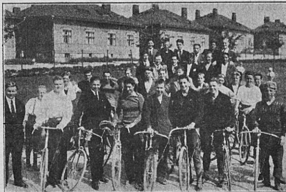
Kilpailun päätyttyä 1931.