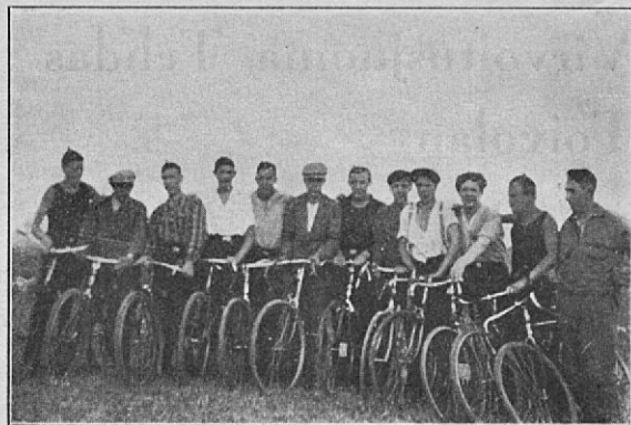
Seuran jäseniä Tikkurilassa.