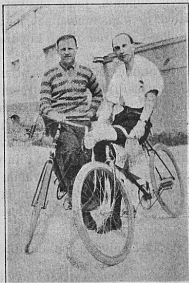
Rahastonhoitaja ja sihteeri