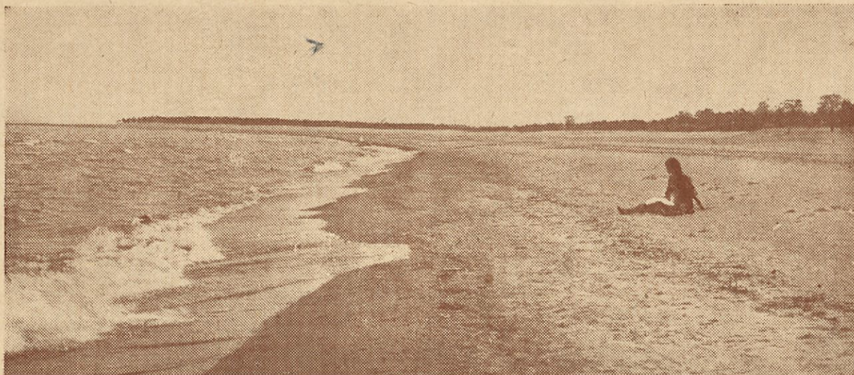
Seiskarin ihanteellista hiekkarantaa.