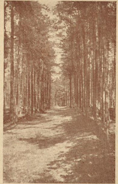
Seiskarin hiljaisia harjuteitä.

Toivomme siis saavamme palvella Teitä. Tullessanne saaremme majakkarantaan kysykää seuramme edustajaa , joka antaa tietoja asunnoista y.m.