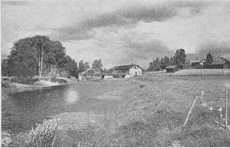
Koulun silta Jalasjärvellä. Vasemmalla sairaalan puistot.

jatkuu Vallin kylille ja sieltä edelleen kappaleen alussa mainittuun määränpäähän.