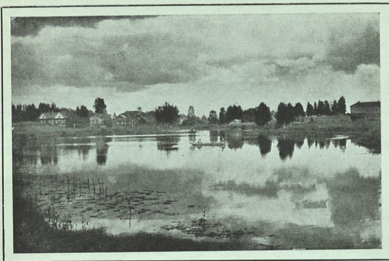
Jalasjärven ranta kirkonkylän kohdalla.