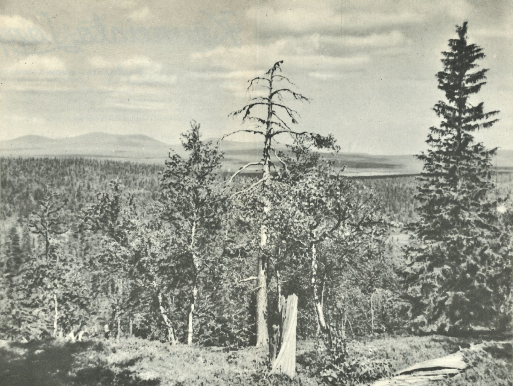
Pallastunturin selänne lännestä.

K aukana Lapissa, suurten Muonion- ja Ounasjokien välissä on Suomen suurin kansallispuisto. Se käsittää Pallas- ja Ounastunturit eli pääosan yli 100 km pitkstä tunturirijonasta, joka kulkee pohjois-eteläsuuntaan länsi-Lapin halki. Näillä tuntureilla, joiden ääriviivat mestarin käsi on aikojen hämärässä piirtänyt kuin harpilla, vallitsee voimakas erämaatunnelma. Alppihuippuja, äkkijyrkkiä seinämiä ja kUILUJA tapaa tuskin lainkaan, täällä pohjolassa ovat kaikki piirteet rauhallisia.