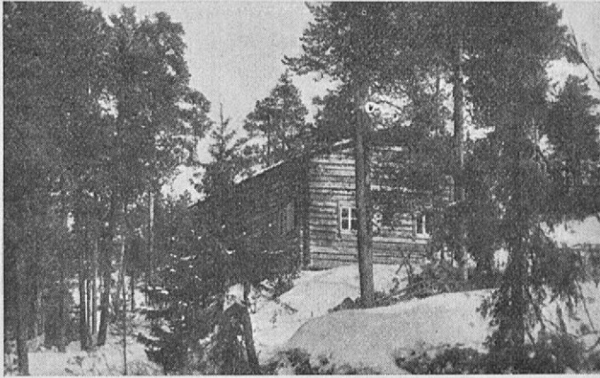
Kiutaköngään erämaamaja talvella.

Paanajärvellä majoittaa matkailijoita, tilaisuuden mukaan, Punaisen Ristin sairausmaja. — Voidaan tehdä moottoriretkiä Paanajärvelle.