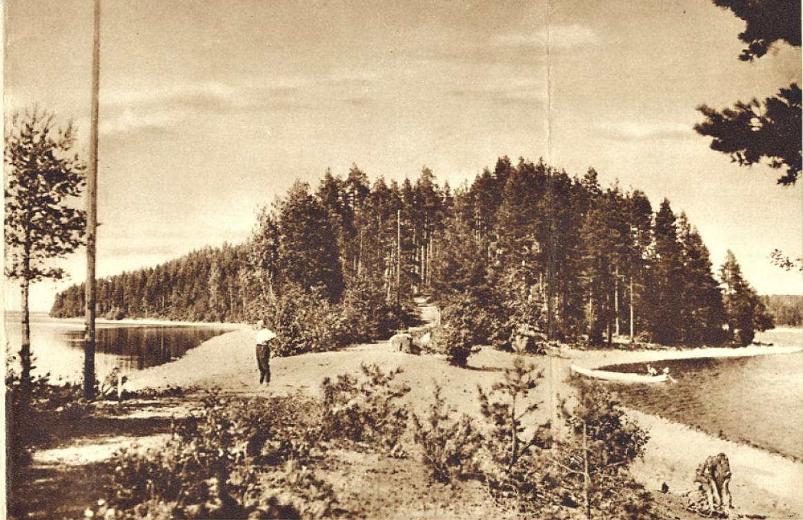
Pulkkilanharjun hiekkarannat ovat houkuttelevan näköiset.