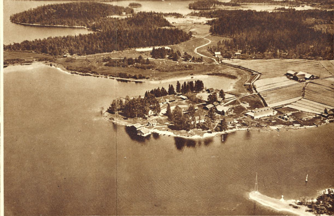
Lentokuva kauniista Kellosalmesta.

joka huolehtii siitä, että jokainen matkailija saa niin pitkälle kuin mahdollista tyydyttää omia halujaan. Niinpä järjestetään lukuisasti tilaisuuksia monenlaisen kalastukseen, uistimen soutuun, ongintaan, nuotanvetoon, y.m. y.m. Edelleen hoidetaan myöskin matkailijoiden ruumiillista puhtautta ja varataan siinä mielessä tarpeellisia saunailtoja. Ohjelma ei kuitenkaan supistu vielä tähänkään. Aikaa ja