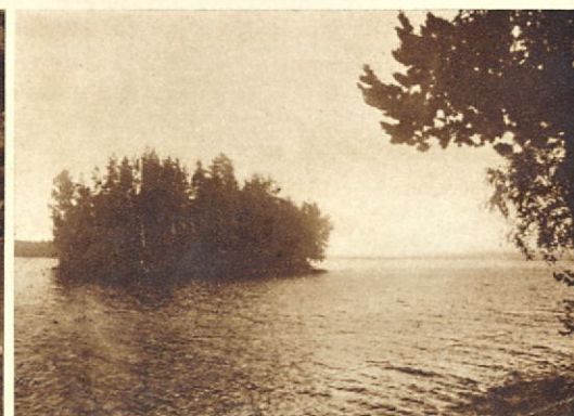
Päijänteiden Kuhmoisten Rekola.