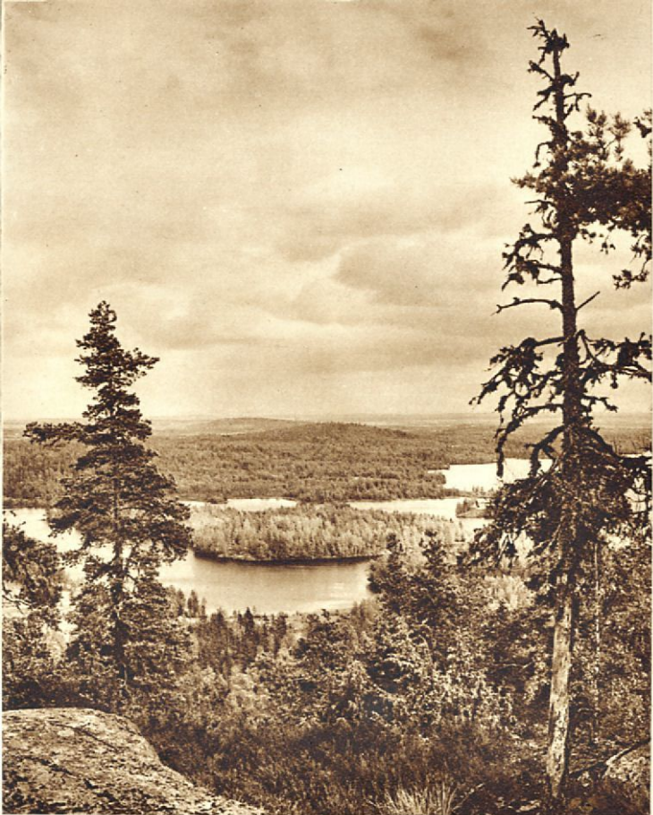
Jylhän kaunis sysmäläinen Päijänne maisema.

koin määrättyä ohjelmaa. Kuitenkin on harju tällöin katsottava, on tutustuttava sen erinomaisiin hiekkarantoihin ja pistäydyttävä ihailemassa idyllistä K ä k ' s a l m e a. Voidaan myöskin ajatella kävely- tai souturetkeä lähellä sijaitsevaan Supitun lahteen . Sen toisella rannalla sijaitsee m.m. yksi vanhimmista, pronssikauden aikaisista polttohautauskalmistoistamme, joka nyttemmin on muheana peltona.