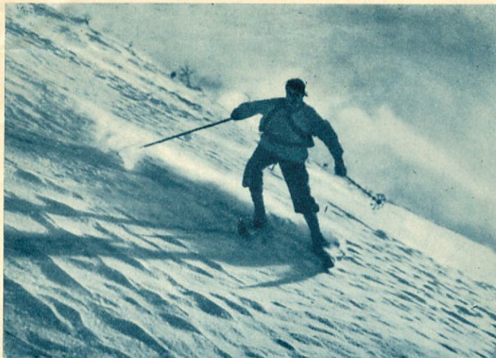
På fjällen gäller det att inte förlora balansen!