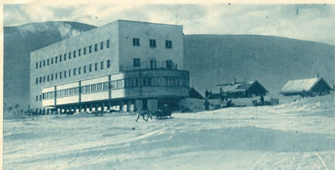
Pallastunturi turiststation en vintermorgon.

t.v. och följer i stället därstädes skidlöparnas märken. En vandring till »Montellin kämppä» kan sommartid förenas med ett besök vid Sarvijärvi, där man får en överblick av den mäktiga fjällväggen speglande sig i vikarnas lugna vatten; avnjutandet av vyn underlättas betydligt av en inbjudande sandstrand. Från Sarvijärvi återvänder man till stationen lämpligast på så sätt, att man vandrar vid foten av fjällets ostsida, passerar Pyhäkuru och når fram till turiststationen längs den lätta passagen över Palkaskuru.