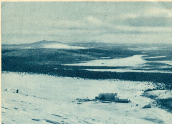
Pallastunturi turiststation sedd från fjällen.