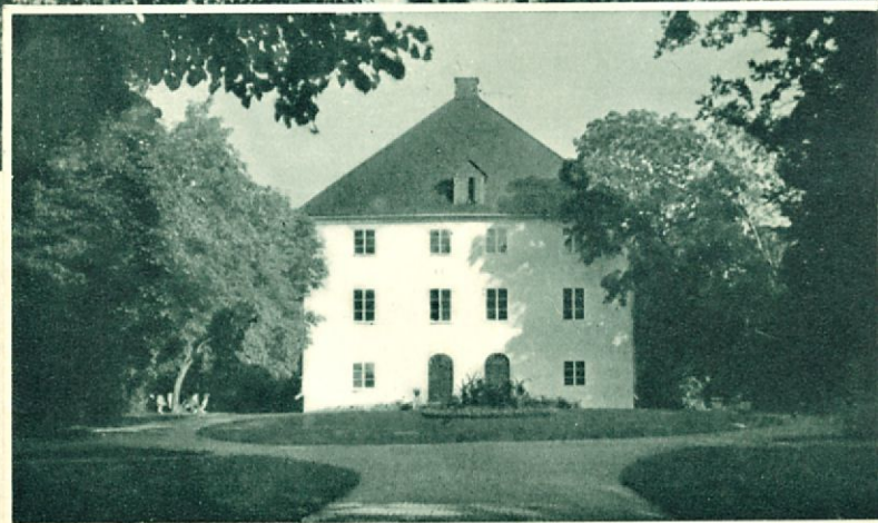
Kankas herrgård (Masku).

Vid slutet av 1200-talet påbörjades byggnadsarbetena på Åbo slott vid mynningen av Aura å. Här residerade till en början medlemmar av Folkunga-ätten; senare har slottet varit bostad för andra av landets mest bemärkta styresmän. Största delen av det s.k. gamla slottet hade tillkommit före medeltidens utgång, medan nya slottet i förborgen byggdes först under Gustav Vasas och Johan III:s tid. Borgen har förskonats varken från ofärdsår eller krig. Men även lysande hovliv har förts inom dess murar, i synnerhet under den tid hertig Johan och hans gemål Katarina Jagellonica förde spiran på Åbohus. Sådant hov hade aldrig förut skådats i Finland: lysande fester med teateruppvisningar, jaktpartier, båtfärder i skärgården m.m. Men det finska hertigdömet's saga räckte icke länge. Redan den 12 aug. 1563 erövrades slottet av Erik XIV:s krigsfolk var-