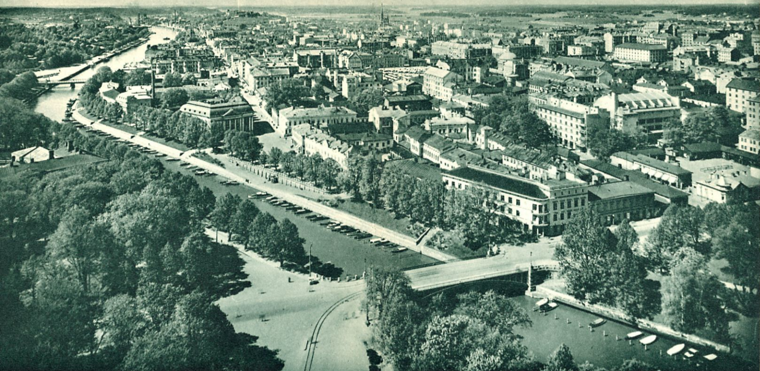
Utsikt från domkyrkans torn.