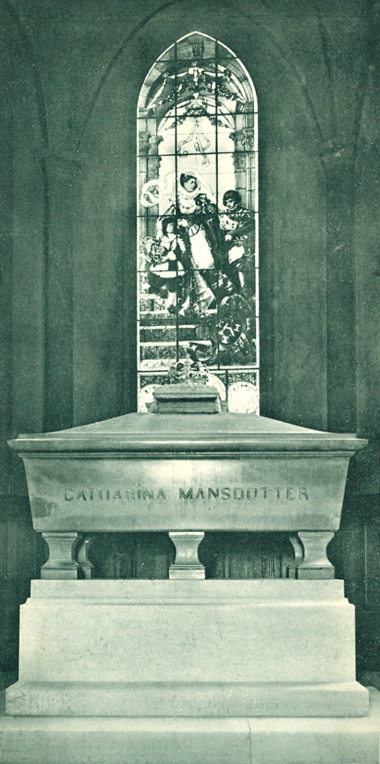
Drottning Karin Månsdotters sarkofag i domkyrkan.