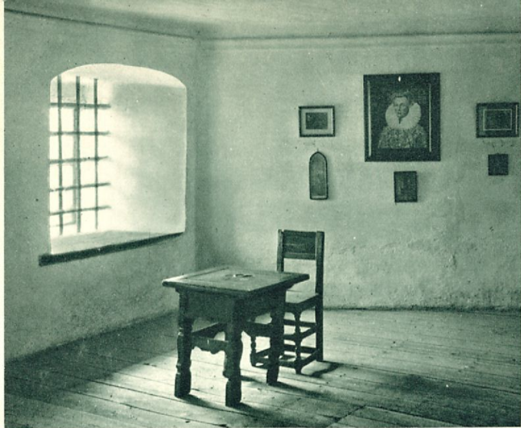
Konung Erik XIV:s fängelse på Åbo slott.

Som skärgårdens centrala bad- och sommarvistelseort har den gamla klosterstaden Nådendal, norr om Åbo, redan ingått i det allmänna medvetandet. Det birgittinerkloster, ett dotterkloster till Vadstena, som år 1445 uppfördes i Vallis Gratiae, Nådendal, har haft en stor betydelse i