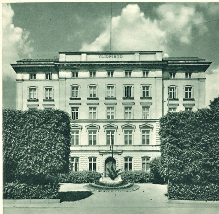
Turun Yliopisto (Åbo Universitet).