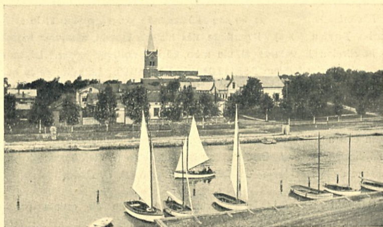
Panoramo pri Uusikaupunki

la lando de sporto, 60,000 idealaj lagoj oportunaj por fiŝkaptado kaj kanotekskursoj, 80,000 insuloj, 700 akvofaloj, mirinde helaj senombraj somernoktoj kaj grandegaj arbaroj konvenaj por ĉasado kaj tendarvivado.