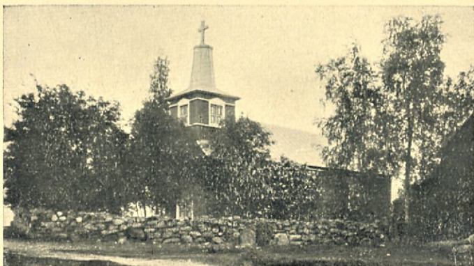
Vilaĝa preĝejo de Untamala