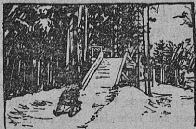
Starttrappen paa Pyynikkiaasen ved Tammerfors.

Det var den svenske Konge Gustav III, der i Aaret 1775 under et Ophold paa det store Gods Hatanpää, der ligger paa en Odde i Pyhäjärvisøen, fik Idéen til Byens Anlæg. Og i 1779 fik Staden, der først byggedes paa Fossens vestlige Bred, sine Privilegier. Dens Vækst var dog til at begynde med kun langsom. I Aaret 1800 havde den endnu kun 463 Indbyggere. Det var først, da Kejser Alexander I i 1819 havde været paa et Besøg dér,