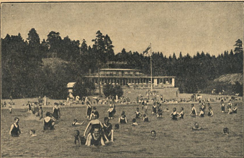
Tupavuori havsbad i Nådendal

En förstklassig dans-restaurang med trivsamma salar och verandor bjuder på dans och musik varje kväll.