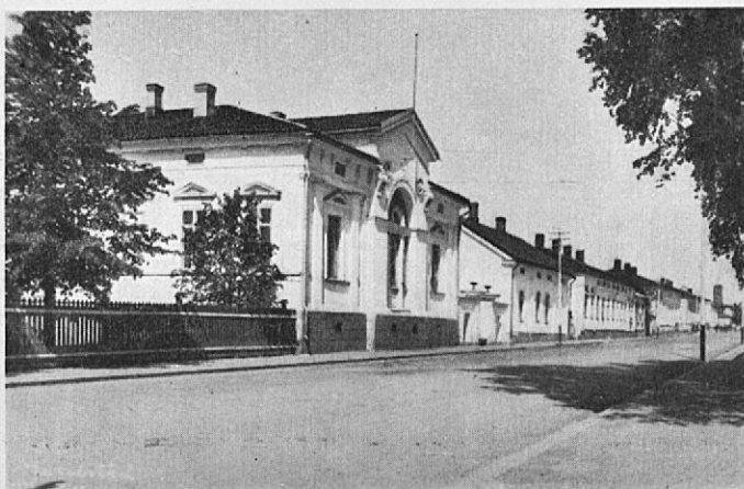
Storgatan med Malmska gården i förgrunden.