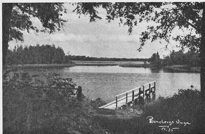
Utsikt från Runebergs stuga.

Hur skuggan där är djup och rik inunder björk och al; hur guldbestrålad varje vik och varje bölja sval.