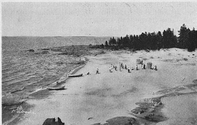
Plagen vid Fäboda kuranstalt.

Jakobstadsbon har för sin sommarutflyttning många möjligheter att välja på. Han kan slå sig ned på en många