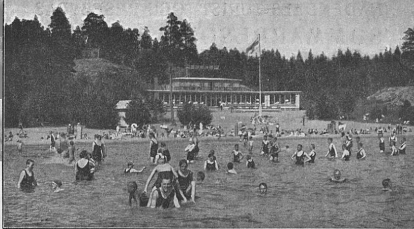
Tupavuori havsbad i Nådendal