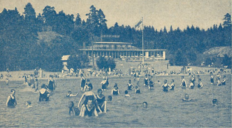
Tupavuori havsbad i Nådendal

En förstklassig dans-restaurang med trivsamma salar och verandor bjuder på dans och musik varje kväll.