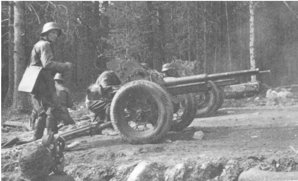
Kuva 5. 25 PstK/34 tulitoiminnassa. 94

tunnettiin nimellä ”Marianne”, jatkossa PstK, ja 76 mm:n lyhyt kanuuna vuosimallia 10/13, jatkossa LK-tykki.