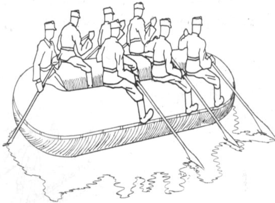
Kuva 2. Iso kumivene ja sen soutaminen. 86

Ison kumiveneen kuljetuskyky oli soutumiehistön, perämies eli veneen päällikkö ja 6 – 8 melojaa, lisäksi 20 miestä täysine varusteineen tai 14 miestä ja raskas konekivääri tai 10 miestä ja 76 mm:n kanuuna ilman etuvaunua. Yhden ison kumiveneen kantavuus oli 3,5 tonnia. Mikäli isoista kumiveneistä rakennettiin lauttoja, saavutettiin jopa 12 tonnin kuljetuskyky. Pienen kumiveneen kuljetuskyky oli 5 miestä varusteineen ja pikakivääri tai 4 miestä ja raskas konekivääri. Pienen kumiveneen kantavuus oli 700 kg. 87 Pyöriäisessä oli kokeiltu ja harjoiteltu panssarintorjuntatykin ja lyhyen kanuunan ylikuljetusta kahdesta pienestä kumiveneestä tehdyllä lautalla. 88