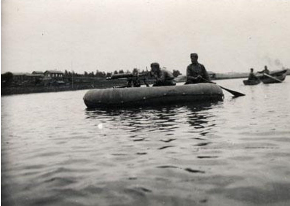
Kuva 4. Raskas konekivääri pienessä kumiveneessä. 91 Kuva on Uudenmaan ratsuväkirykmentin harjoituksesta 1920-luvulta, jolloin jo oli ainakin kokeiltu ylimenoon liittyen raskaan konekiväärin käyttöä pienestä kumiveneestä ylimenon tukemiseksi.

Konekiväärirykmentin harjoittamista jatkettiin kuljetus harjoituksilla niin veneissä kuin vaihtelevassa maastossa. Aseenkäsittelyharjoituksissa siirryttiin suuntausharjoituksiin liikkuvaan maaliin maalla, vedessä ja ilmassa. Ampumatoiminnassa ampumista harjoiteltiin rajoittimia käyttäen pimeällä ja savuverhon lävitse. 92