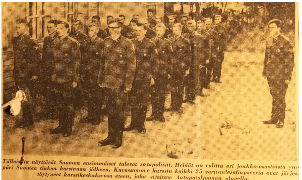
Kuva 2. Sotilaspoliisikoulun ensimmäisen kurssin I/63 oppilaat

Sotilaspoliisikoulun johtaja sai puolustusvoimain komentajan esittelyssä 6.8.1963 sotaväen järjestyssäännön mukaisen komppanian päällikön rankaisuvallan kurssin oppilaiden suhteen. 45