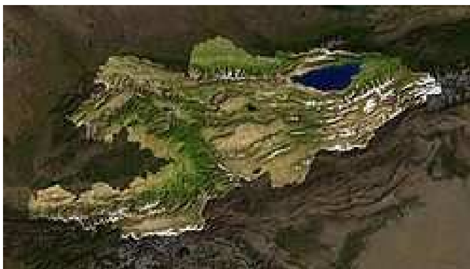
Satelliittikuva Kirgisiasta. Kesäisestä kuvasta ilmenee ikijäätiköt, vesistöt, viheralueet ja vuoristot.

Vuoristo tekee Kirgisian maaston vaikeakulkuiseksi. Harvan tieverkoston linjauksia ohjaa noin 80 prosenttisesti Kirgisian pinta-alan kattava Himalajaan kuuluvien Tien Shanin ja Pamirin vuoristot. Itä-länsi suuntaiset vuoristot jakavat Kirgisian pohjoiseen ja eteläiseen osaan. Kirgisian korkein vuorenhuippu on Jengish Chokusu (Пик Победы) 7 439 metriä merenpinnan yläpuolella, joka sijaitsee aivan Kirgisian itäkärjessä. 9